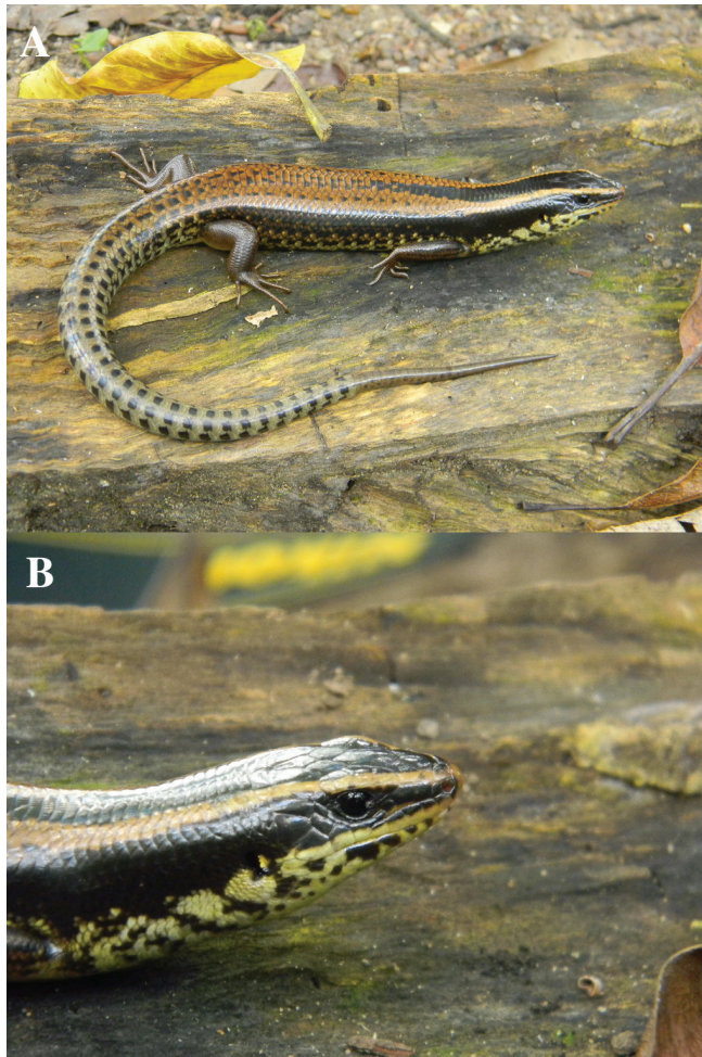
Figura 1. A y B: Mesoscincus schwartzei (adulto) registrado en Playón de la Gloria, Márquez de Comillas, Chiapas México.

Museum of Natural History, Louisiana State University LSU 33345-33346: 16 km al oeste de Bacalar, Quintana Roo, México; Smithsonian National Museum of Natural History, Washington, D.C. USNM 113607-113608: Tenosique, Tabasco México. Así mismo Ferreira (2005) menciona que revisó un ejemplar de M. schwartzei encontrado en la zona de Yaxchilán, Chiapas depositado en el Museo de Zoología, Facultad de Ciencias (MZFC12181), de la Universidad Nacional Autónoma de México. Calderón-Mandujano et al. (2008) registraron un solo ejemplar para el norte de la reserva de la biosfera Sian Ka'an, Quintana Roo.