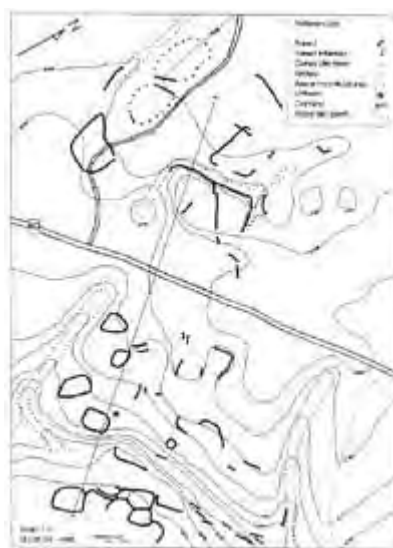
Figura 2. Plano del valle de Calichaga con la localidad de Suiza.