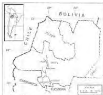
Figura 1. Ubicación del valle Calichaga, provincia de Suiza, al encontrarse en el paso argentino.