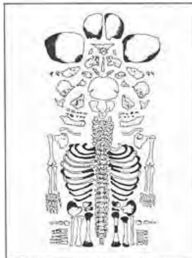
Figura 3b. Partes recuperadas del esqueleto. Las partes perdidas se presentan sombreadas.