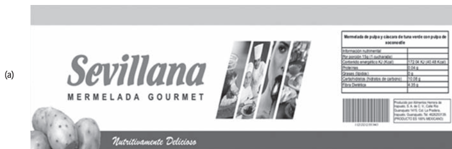
Figura 4. Diseño de etiqueta.

El análisis químico proximal de la mermelada de tuna procesada a nivel planta piloto, se muestra en la tabla 1, donde se observa que la fibra dietética fue de 29.06 g / 100 g de producto. El alto contenido de fibra dietética en la mermelada de tuna fue debida al aporte de cáscara (5.7 %) en la formulación. Se ha reportado un trabajo de investigación de mermeladas de tunas rojas, con aporte de 22.38 % de cáscara en la formulación, logrando un valor de 12 g / 100 g de fibra dietética en la mermelada elaborada (Arias y Herrera, 2008). Al respecto, es importante mencionar que la cáscara de tunas verdes posee una dureza considerable proporcionada por la fibra, a diferencia de la cáscara suave de las tunas rojas, de aquí que es posible considerar que la cantidad de fibra dietética en la