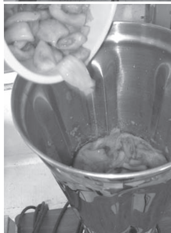
Figura 2. (a) Despulpadora, (b) triturador.