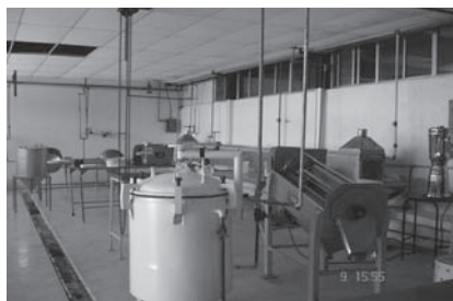
Figura 1. Planta piloto para la elaboración de mermeladas.

acidez alta (pH por debajo de 4.6), razón por la cual el tratamiento térmico aplicado fue de pasteurización (Ramaswamy and Marcotte, 2006). El producto terminado se muestra en la figura 3, en donde el frasco de mermelada lleva una etiqueta, diseñada con la información nutricional (figura 4) requerida para su posible comercialización.