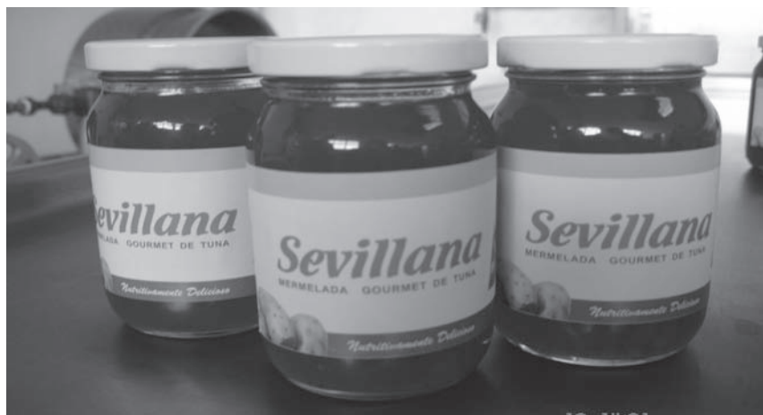
Figura 3. Mermelada de Tuna.