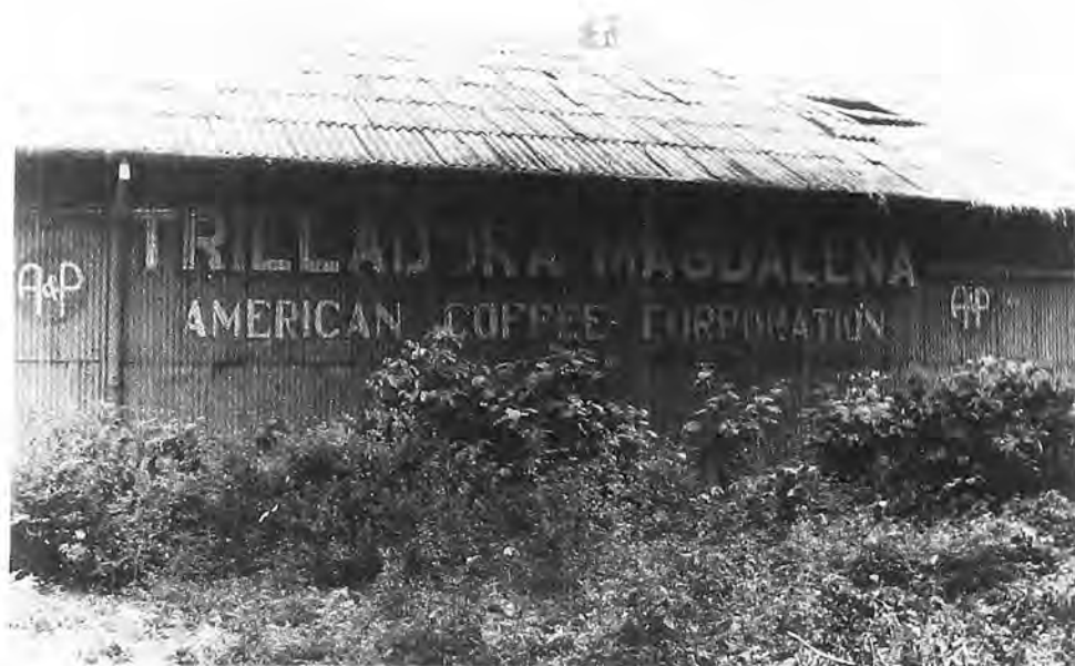
Bodegas de American Coffee. Fotografía tomada en 1998.