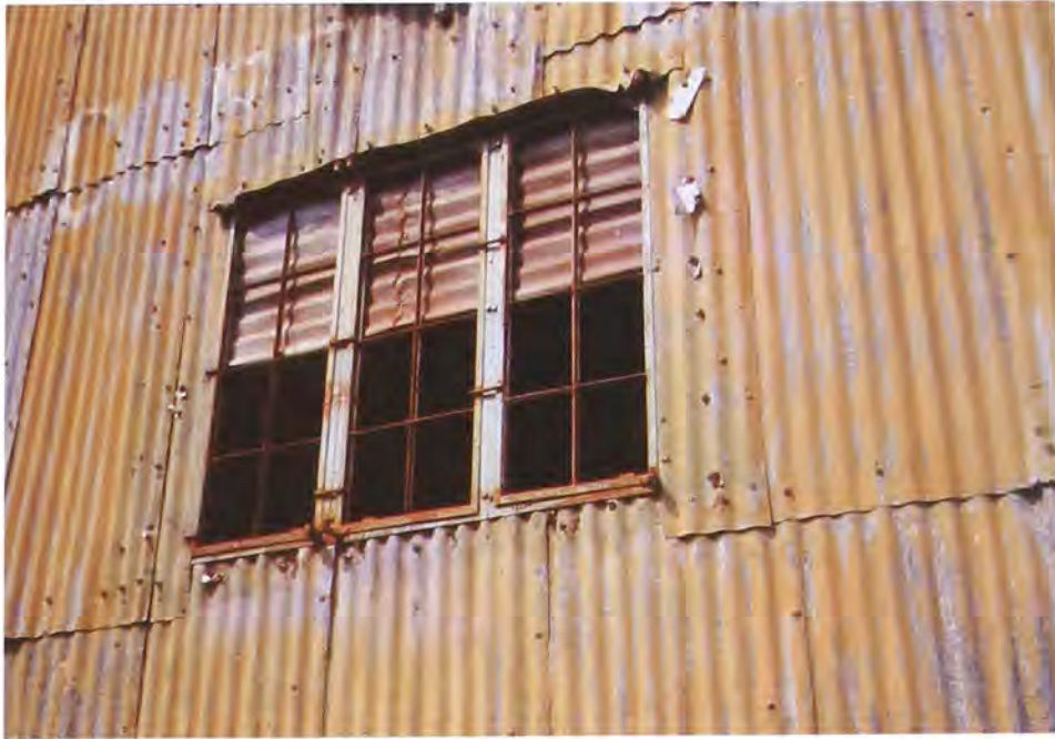
Ventana de la bodega en la que se hallaban los talleres del Cable Aéreo.

Salvo dos o tres todos [los ingleses] murieron en Colombia: Blackett en Bogotá, Nicholas en Honda, Mientras que Frost y Kippen se marcharon. La empresa también tuvo un sindicato que afilió a trabajadores de las dos empresas (Ferrocaril y Cable), casi todo el personal, excepto treinta o cuarenta. Se entendía con aspectos de salubridad y enfermedad. Hubo huelgas y rechazo a Gaitán.