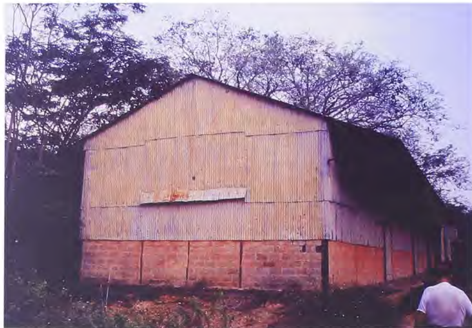
Vista de la bodega de American Coffee.

reclamando en esta instancia la misma prestación negada por el Departamento Jurídico Laboral en marzo de 1964.