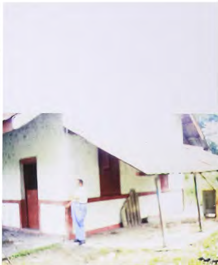
Taquilla de venta de tiquetes en la Estación.