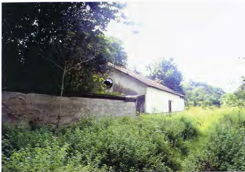
Aspecto de una de las bodegas del ferrocarril.

dencias, conforme el modelo de administración militar que se acogió en las ferroviarias del país, un tratamiento ambiguo se revela respecto del otorgamiento del beneficio pensional a los empleados de acuerdo con su nacionalidad. Mientras estuvo en manos de los ingleses, el estilo de gestión se acercó a las tendencias paternalistas propias de algunos empresarios de la industrialización colombiana. Pero cuando se trató de dar garantía a los derechos de los propios ingleses, ya desde la instancia nacional de dirección del sistema de transporte férreo se les aplicó una fórmula de desconocimiento de tales derechos.