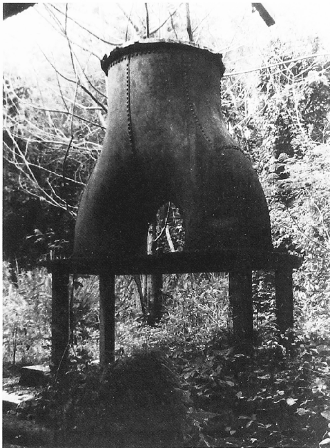
Tornamesa en la que se colocaba la locomotora. Fotografía tomada en 1998