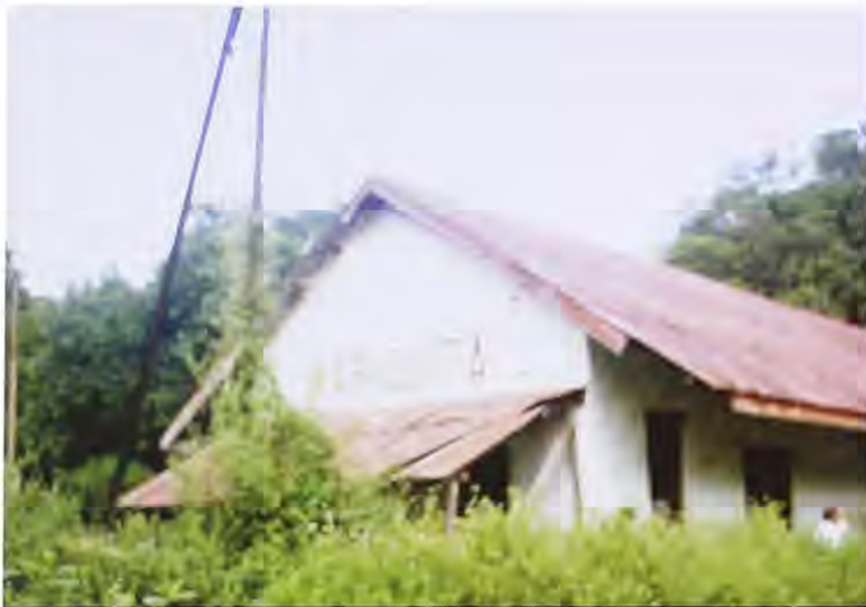
Estación de Mariquita del Ferrocarril de La Dorada.