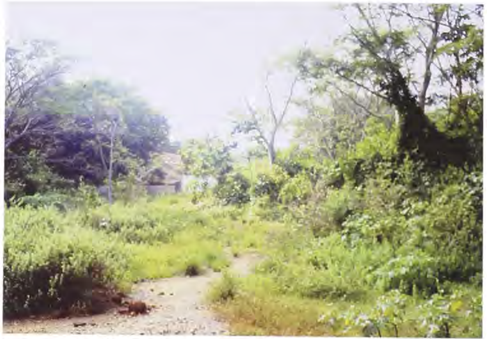
Sendero en predios de la Estación.

pasajeros no asimilaban la puntualidad, arribando a Honda en 35 minutos, con cuatro trenes. Posteriormente llevaban vagones de carga (día y noche). Más adelante empezaron a funcionar carreteras paralelas. La situación se puso delicada con motivo de la disminución de la movilización como resultado de la construcción de otras vías que hacían más cómodo el manejo del comercio. Al disminuir su uso se desmejoró el cuidado de la vía 16 .