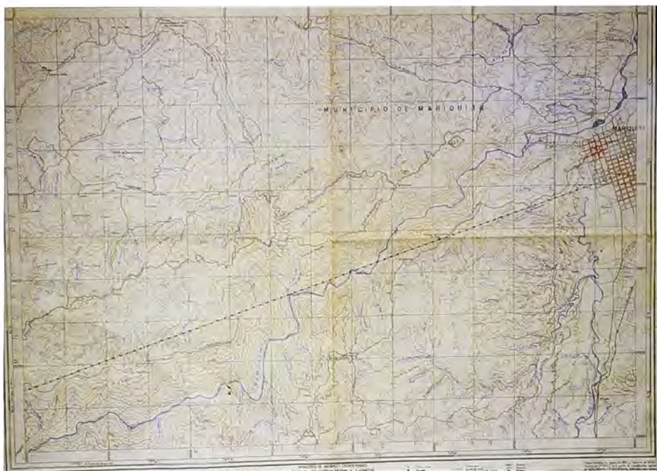
Mapa, aparece el trazado del Cable Aéreo y la Estación San Diego. Ministerio de Hacienda y Crédito Público. Instituto Geográfico Militar y Catastral, 1949.