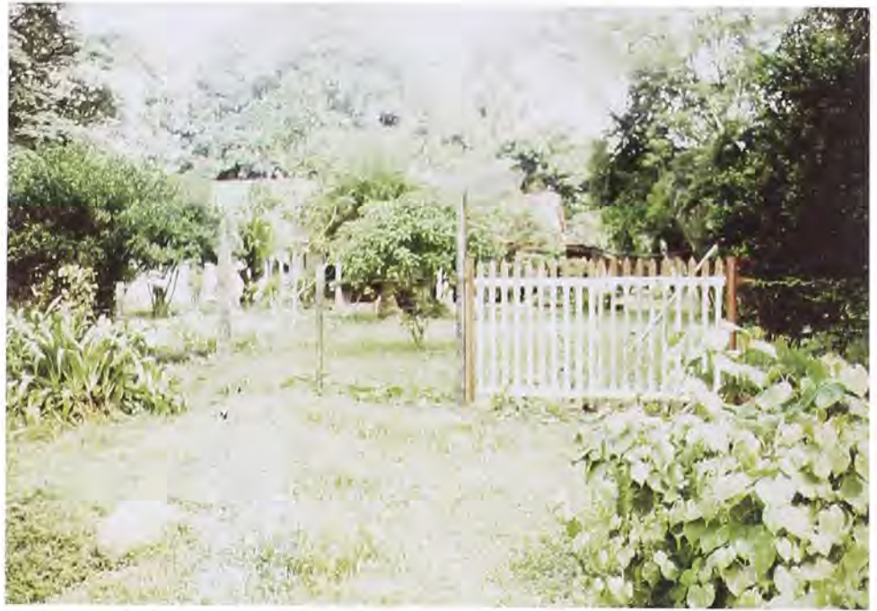
Verja que rodeaba el campamento.