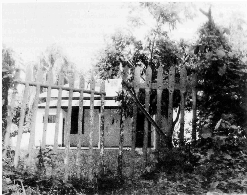
Portería de la Estación. Fotografía tomada en 1998, archivo Hernando Ávila Venegas, Centro de Historia de San Sebastián de Mariquita.

do ahora sería parte de la solución a problemas como la ausencia de vías multifuncionales de comunicación —y por ende la dependencia del transporte terrestre— e infraestructura que exige el proceso de integración económica a la globalización.