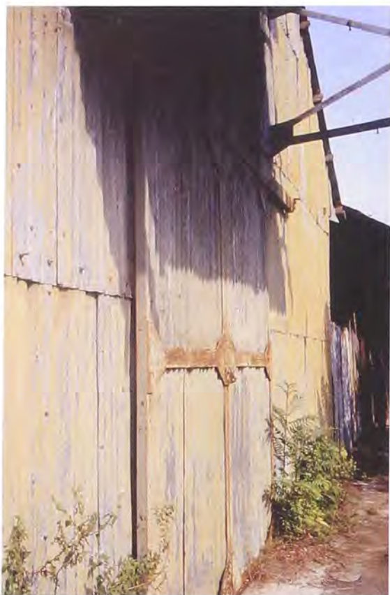
Portón de corredera en las bodegas del Cable Aéreo.