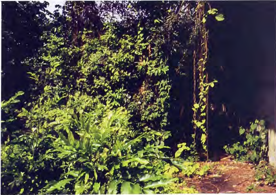
Densificación vegetal de las bodegas.

El contraste es claro: por una parte fracaso en las estrategias de importar ciudadanos europeos como factores de progreso material y civilización en términos masivos. Cualitativamente, una impresionante colección de aportes individuales a la cristalización de actividades modernizantes de toda índole. En el fondo, la aceptación de que quizá por efectos de la leyenda de El Dorado, el porvenir de la ilusión inmigratoria no podía ir más allá de un veni, vidi, vici , y que más que inmigración controlada, la experiencia nacional no dejaría de ser la de un permanente escenario de ascenso social para sus visitantes.