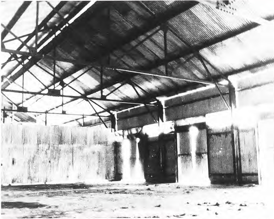
Interior de la bodega en la que se instaló la rueda sinfín del Cable para el trayecto Mariquita-San Diego. Fotografía tomada en 1998