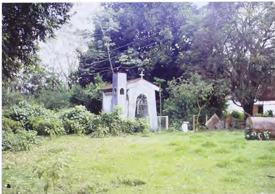
Capilla adyacente a la Estación de Mariquita.

La administración “estatizada” de la empresa no fue aceptada por los operarios, y un recuento posterior menciona que: