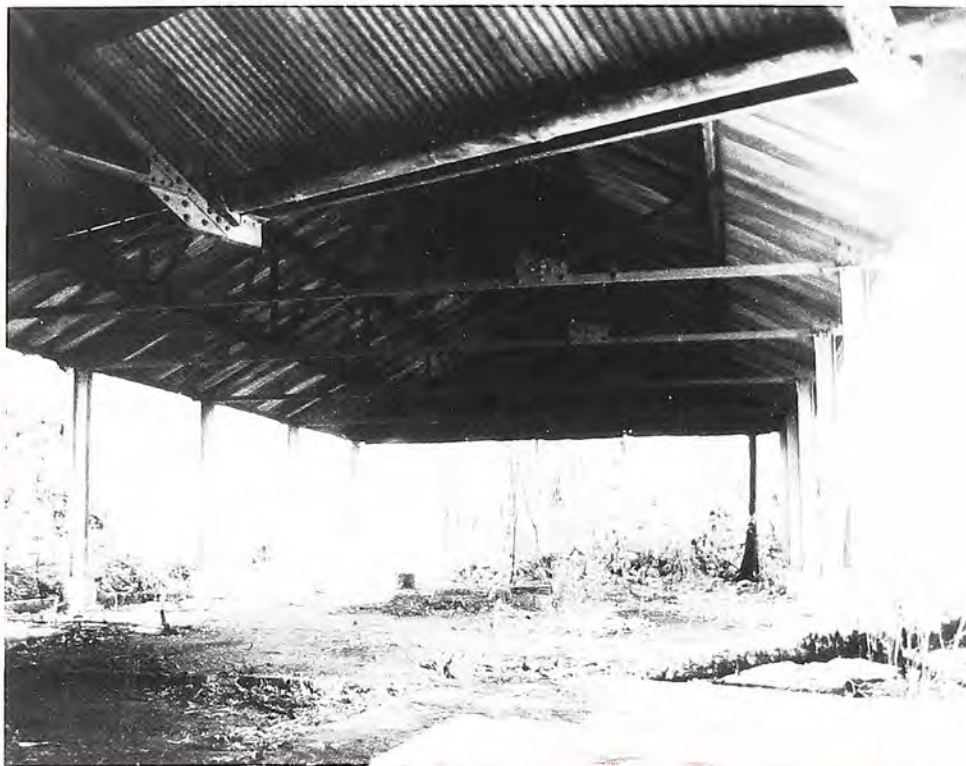
Interior de la Terminal del Cable. Fotografía tomada en 1998, archivo Hernando Ávila Venegas, Centro de Historia de San Sebastián de Mariquita.

limitados espacios de trasculturizar los modos de vida de los ingleses, y de los demás inmigrantes procedentes de naciones con creencias religiosas diferentes.