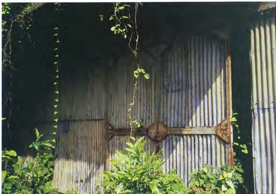
Detalle de la herrajería y mampostería de las instalaciones.

La pensión de Díaz sólo había sido factible como resultado de la presión de los trabajadores del Ferrocarril de La Dorada para que la empresa diera cumplimiento a lo ordenado por el artículo 15 del Decreto 1471 de 1932