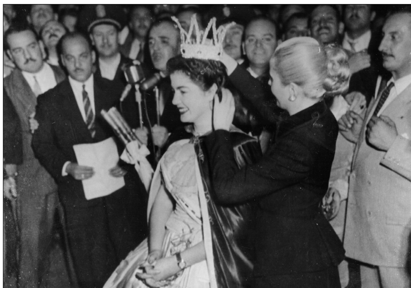
Fig. 23.—Eva Perón corona a la Reina Nacional del Trabajo de 1949, 1 de mayo de 1949, AGN.