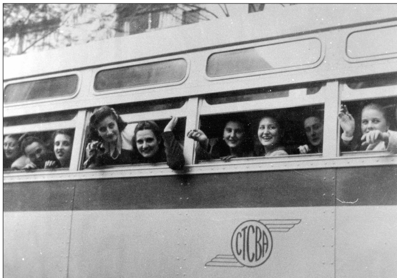
Fig. 26.—Candidatas a Reina Nacional del Trabajo pasean por la ciudad de Buenos Aires, diario La Razón , s.f.