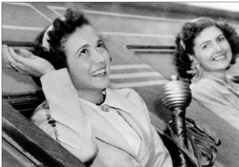
Fig. 25.—Representantes regionales y provinciales llegan a la ciudad de Buenos Aires, 1950, AGN.