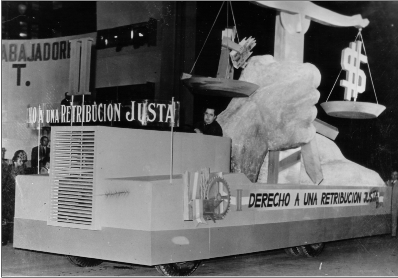
Fig. 7.—Carroza que representa el “Derecho a una Remuneración Justa”, 1 de mayo de 1948.