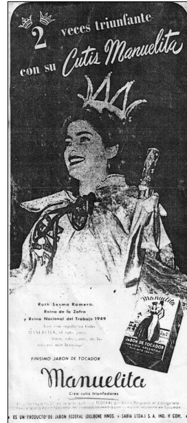
Fig. 1.—1949, Propaganda de Jabón Manuelita de la compañía Jabón Federal, Democracia , 5 de mayo de 1949.