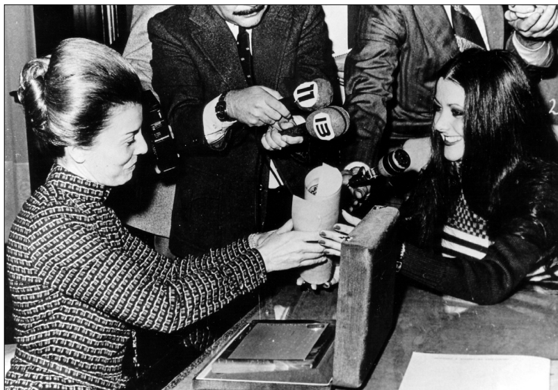
Fig. 33.—Isabel Martínez de Perón entrega el certificado de Reina Nacional del Trabajo de 1975, AGN.