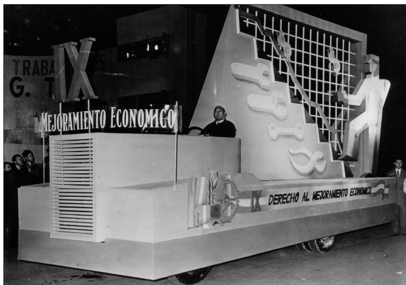
Fig. 14.—Carroza que representa el “Derecho al Mejoramiento Económico”, 1 de mayo de 1948, AGN.