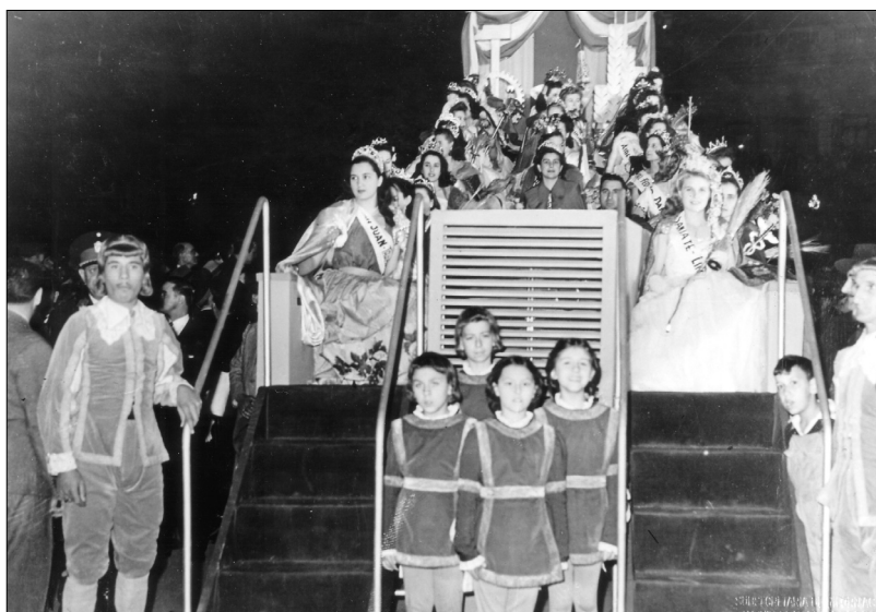
Fig. 19, Varios pajes reciben a las reinas del trabajo, 1 de mayo de 1948, AGN.