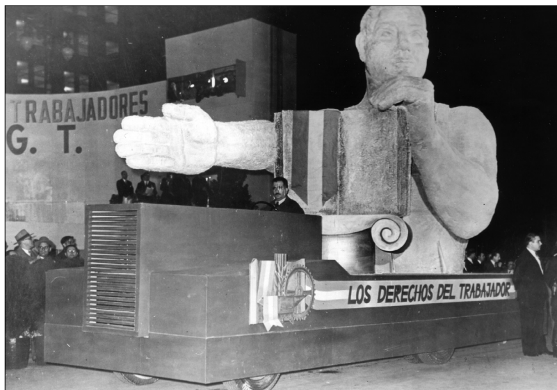
Fig. 5.—Carroza que representa los “Derechos del Trabajador”, 1 de mayo de 1948, AGN.