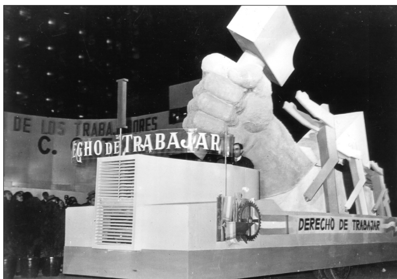
Fig. 6.—Carroza que representa el “Derecho a Trabajar”, 1 de mayo de 1948, AGN.