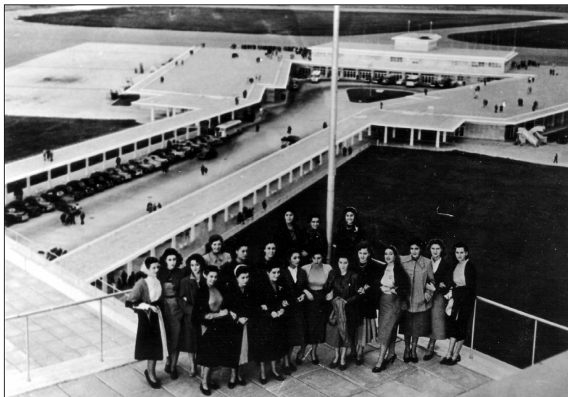
Fig. 27.—Candidatas a Reina Nacional del Trabajo durante una visita al Aeropuerto Internacional de Ezeiza, 1952, AGN.