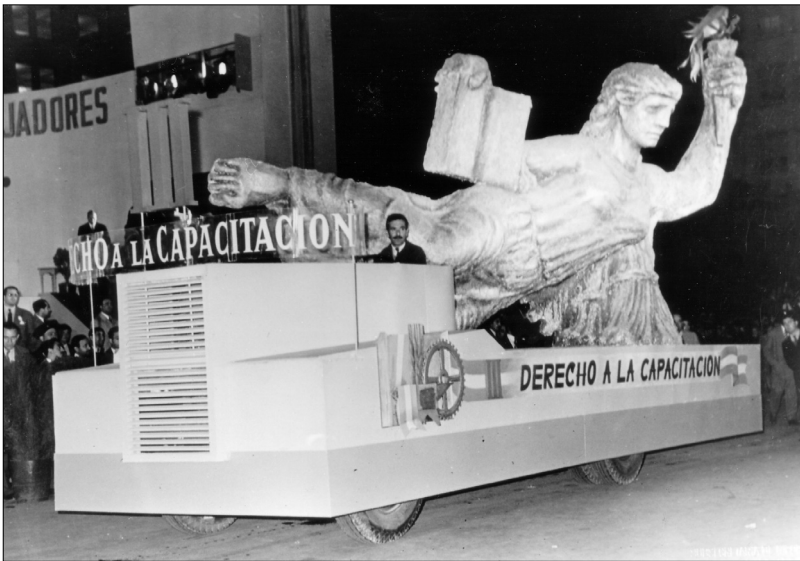
Fig. 8.—Carroza que representa el “Derecho a la Capacitación”, 1 de mayo de 1948, AGN.