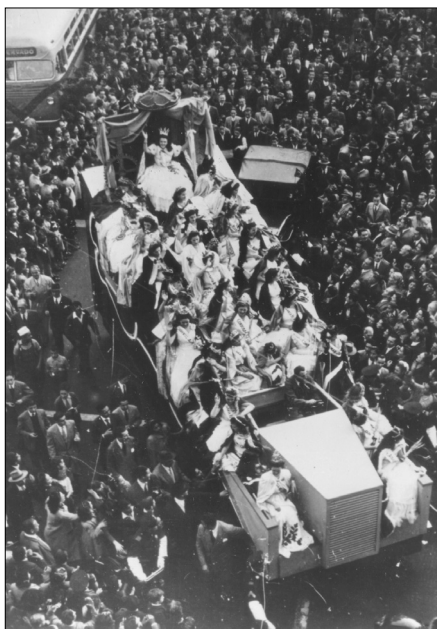
Fig. 31.—La Reina Nacional del Trabajo rodeada por la multitud, 1 de mayo de 1949, AGN.