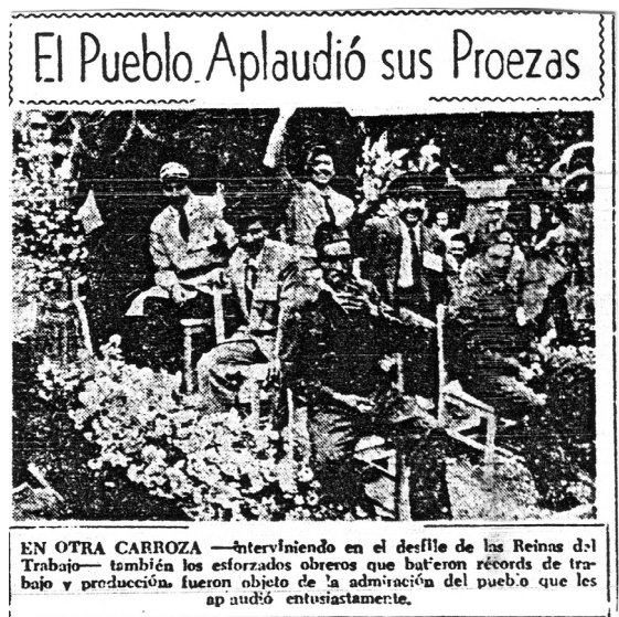
Fig. 32.—Trabajadores que cumplieron metas de producción desfilan el 1 de mayo de 1951. El Laborista , 3 de mayo de 1951.