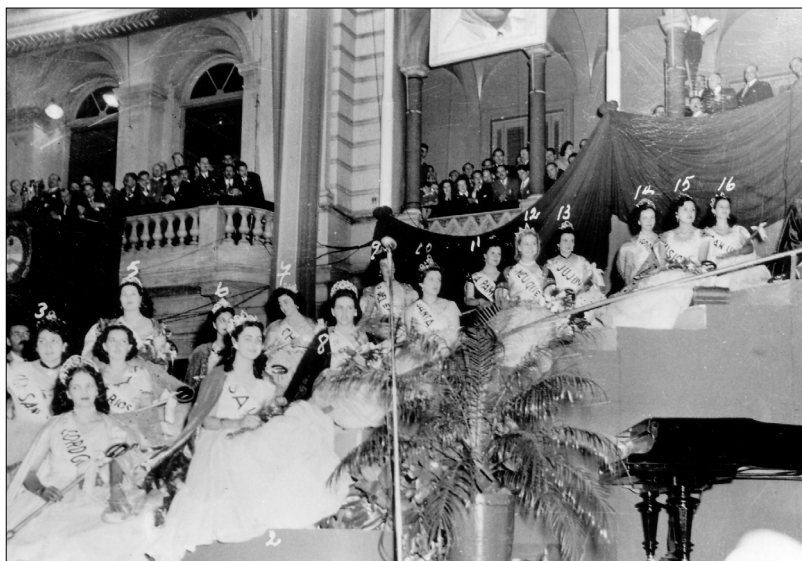
Fig. 18.—Reinas del trabajo, 1 de mayo de 1950, AGN.