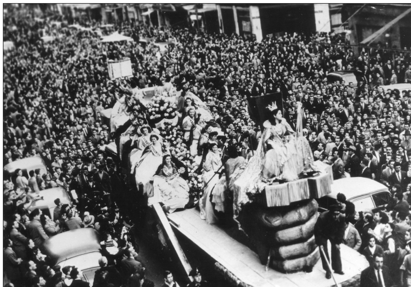
Fig. 30.—Desfile en la Ciudad de Buenos Aires, 1 de mayo de 1949, AGN.