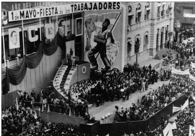
Fig. 4.—1 de mayo de 1950, AGN.