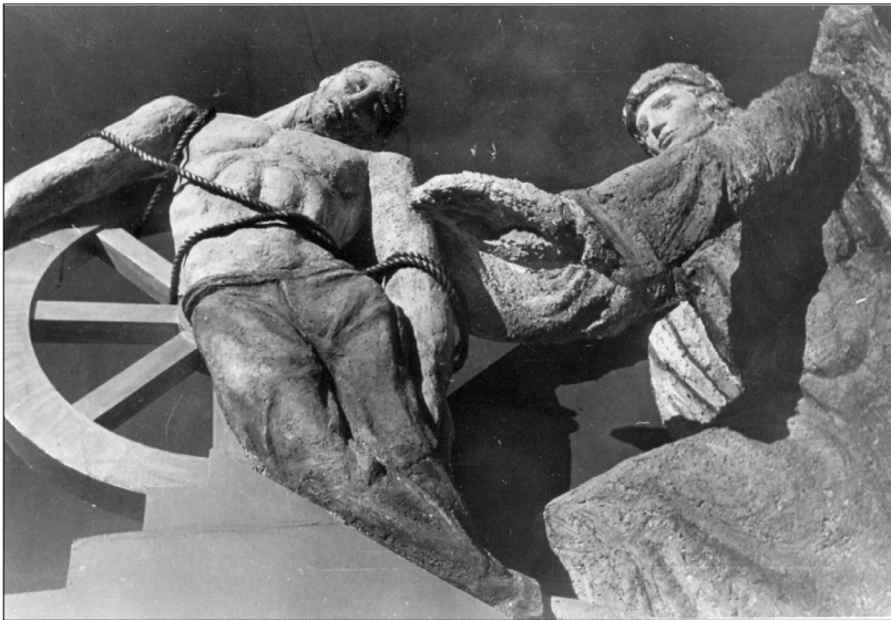
Fig. 16.—Figura alegórica de la carroza que representa el “Derecho a la Seguridad Social”, 1 de mayo de 1948, AGN.