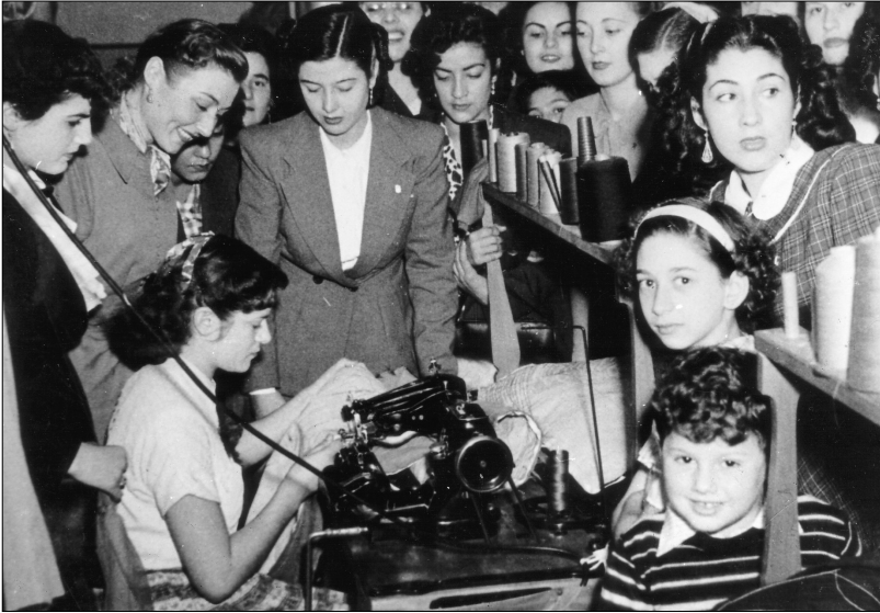
Fig. 28.—Las candidatas a Reina Nacional del Trabajo visitan una planta textil y estimulan a las jóvenes trabajadoras a cumplir con las metas de producción, 1951, AGN.