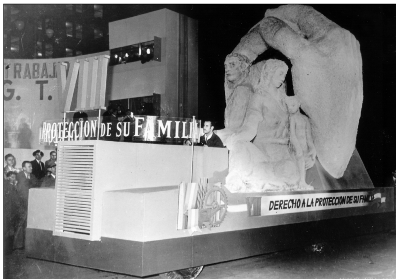
Fig. 13.—Carroza que representa el “Derecho a la Protección de la Familia”, 1 de mayo de 1948.