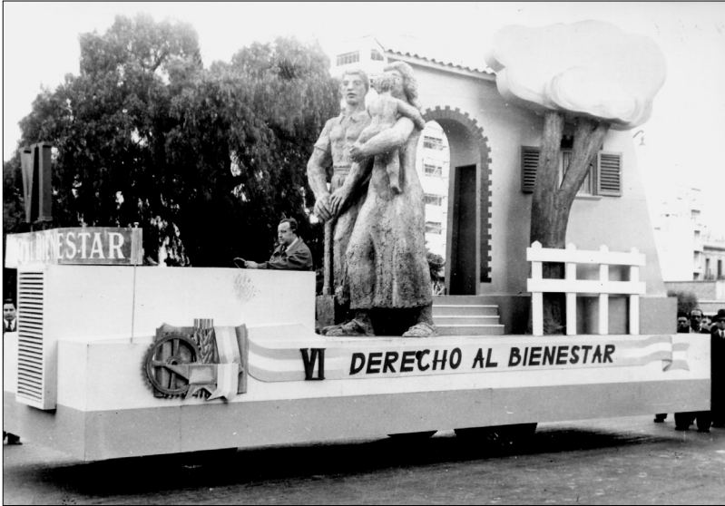
Fig. 11.—Carroza que representa el “Derecho al Bienestar”, 1 de mayo de 1948, AGN.