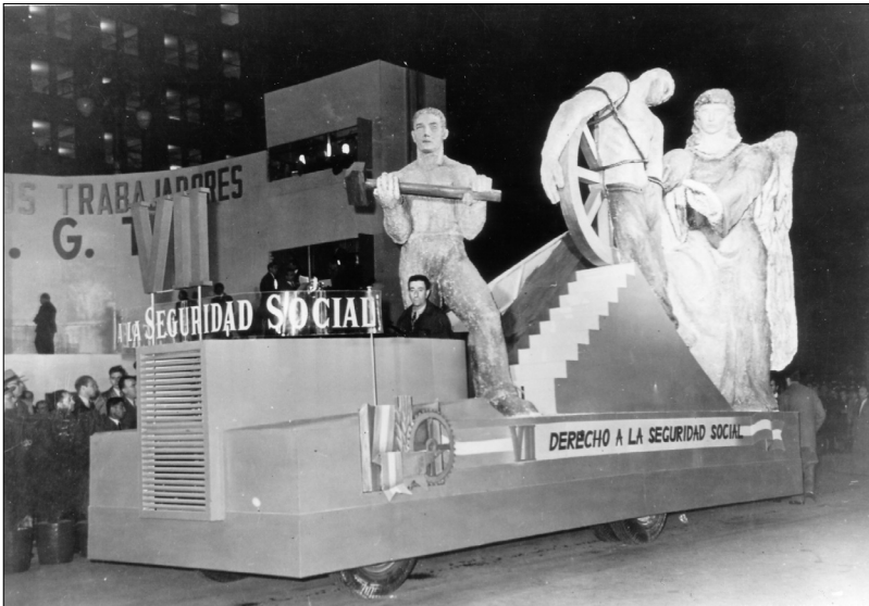
Fig. 12.—Carroza que representa el “Derecho a la Seguridad Social”, 1 de mayo de 1948, AGN.