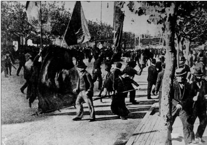
Fig. 2.—Manifestación del 1 de mayo de 1909. Entre los manifestantes destaca una mujer con una bandera que escapa de la represión policial.