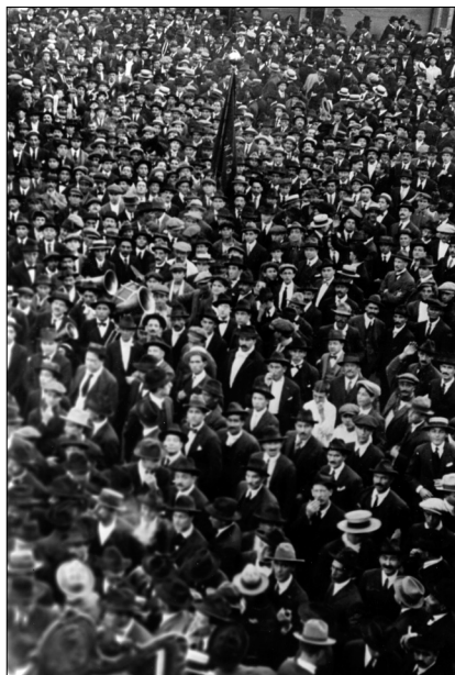
Fig. 3.—Manifestación socialista del 1 de mayo de 1924.