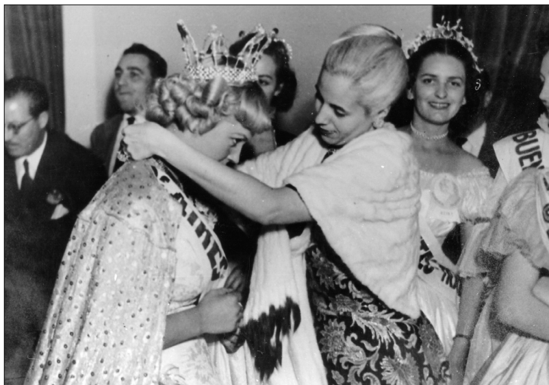
Fig. 22.—Eva Perón y las candidatas a Reina Nacional del Trabajo, 1 de mayo de 1949, AGN.