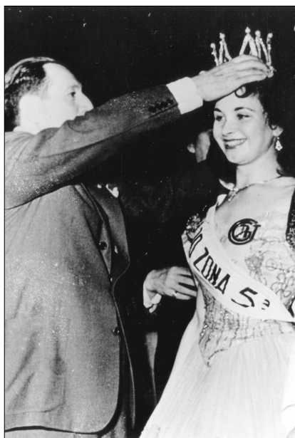
Fig. 24.—Juan Domingo Perón corona a la Reina Nacional del Trabajo de 1955, 1 de mayo de 1955, AGN.