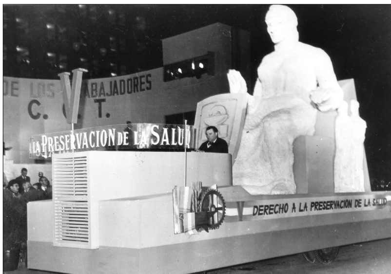
Fig. 10.—Carroza que representa el “Derecho a la Preservación de la Salud”, 1 de mayo de 1948.