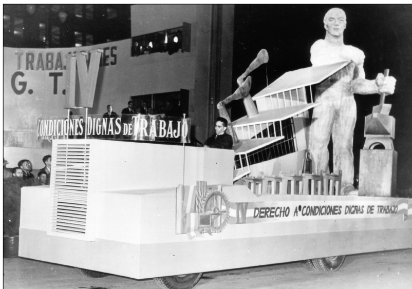
Fig. 9.—Carroza que representa el “Derecho a Condiciones Dignas de Trabajo”, 1 de mayo de 1948, AGN.