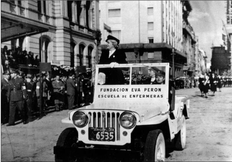
Fig. 17.—Enfermeras desfilando, Archivo del diario La Razón , s.f.

Es interesante señalar que la iconografía de la mujer durante el peronismo se apoya en la profusión de imágenes hogareñas, de mujeres sentadas frente a una máquina de coser, recibiendo al esposo cuando regresaba de su trabajo o despidiendo a los niños rumbo a la escuela. El hogar, apacible, ordenado, armónico era el “lugar” de la mujer y ella estaba dispuesta a realizar enormes esfuerzos por los otros. Su abnegación y altruismo se sublimaba en la figura de la enfermera (Fig. 17). Pero acorde con el discurso industrializador del peronismo, la imagen por excelencia en afiches de propaganda, folletos e incluso en los cortos publicitarios de cine es la figura masculina vestida de overall que representa al trabajador urbano industrial. Esta imagen compite con la representación del descamisado, símbolo del proceso disruptivo que había protagonizado el pueblo el 17 de octubre de 1945. 27