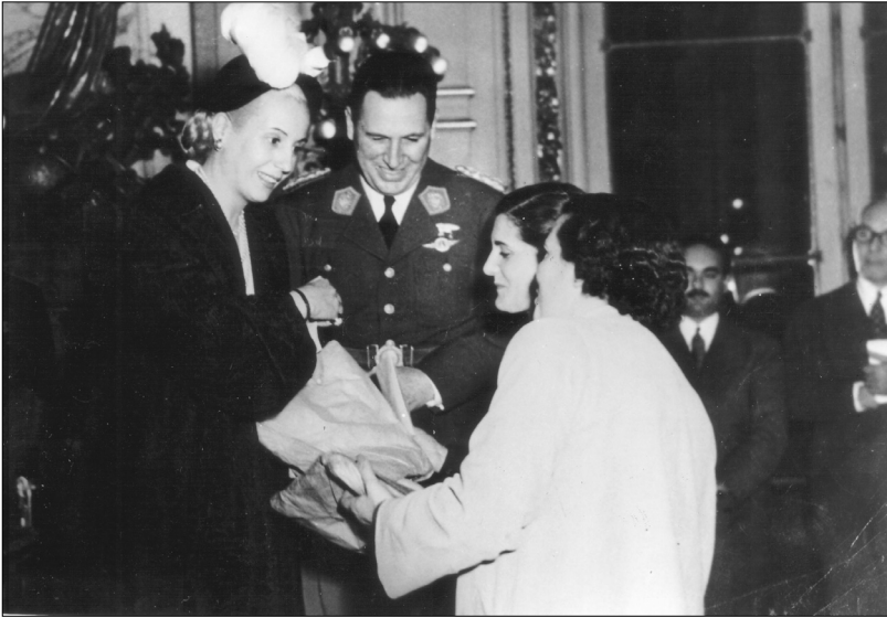
Fig. 29.—Perón y Evita reciben a las jóvenes trabajadoras que cumplieron metas de producción en la Residencia Presidencial, 1951, AGN.