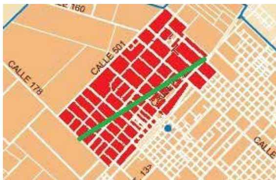
Localización: Unión y nuevo asentamiento

sonas “que nunca más volvieron a aparecer”, otros iniciaron el pago de interminables cuotas a la espera de obtener un título de propiedad. El imaginario de ser “propietarios” de las viviendas y de “pagar por lo que se adquiere” tiene un peso muy grande entre los habitantes de Unión y opera como una demarcación simbólica entre vecinos; volveremos sobre esta cuestión más adelante. 3