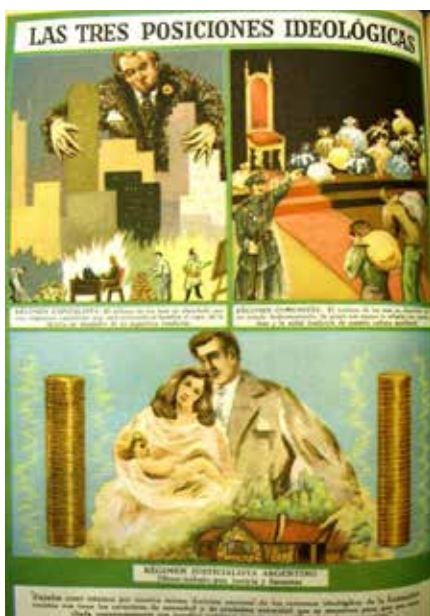
Imagen N° 1

Este proceso era sostenido por una maquinaria de propaganda (Gené, 2008; Vasquez, 2008) dispuesta a resaltar las virtudes del justicialismo frente a las otras dos formas de organización social –el capitalismo y el comunismo– (ver imagen N° 1). Romero sostiene su análisis en la elevación de la Doctrina Peronista a Doctrina Nacional en la Constitución de 1949 y su énfasis en la Comunidad Organizada como horizonte político para la conformación del Estado, objetivo sin dudas promovido por Perón. Efectivamente, la Constitución de 1949 es un hito