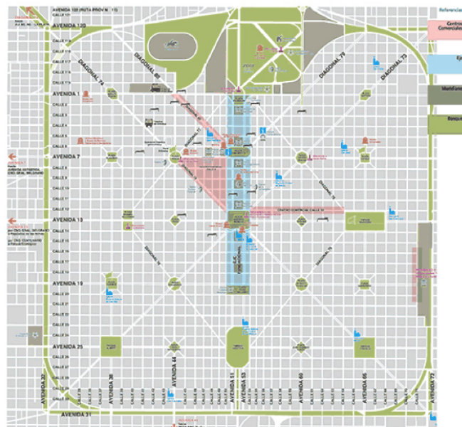
Mapa del casco urbano de La Plata.