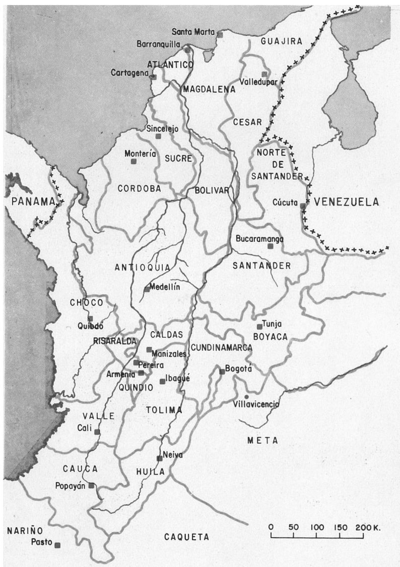
MAPA 1. COLOMBIA CENTRAL Y OCCIDENTAL