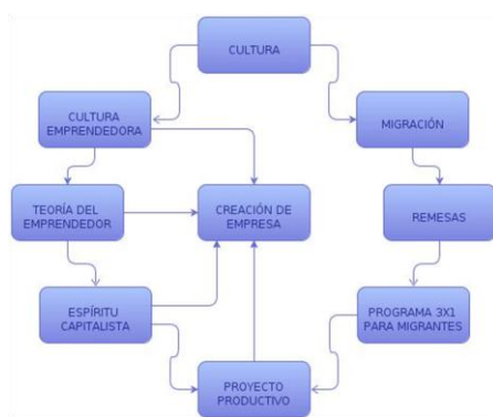
Figura 3. Creación de empresa

a) La existencia de oportunidades, b) El descubrimiento de oportunidades y c) La explotación de oportunidades.