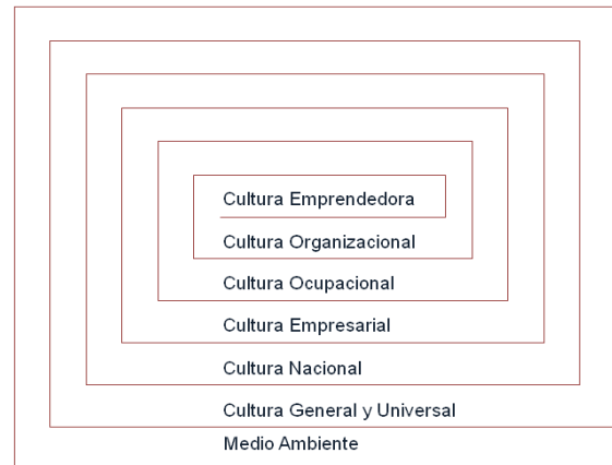
Figura 2. Cultura