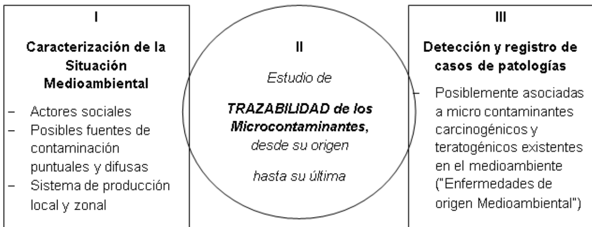
Figura 2. Esquema metodológico para las situaciones observacionales más frecuentes en éste tipo de estudios

La base de la aplicación de estos modelos es la convicción de que no se pueden aislar los fenómenos de contaminación de origen antrópico o natural en todas sus formas y niveles de la calidad del agua de consumo, y tampoco de la salud humana y de los procesos sociales; ya que en última instancia las redes de relaciones a nivel fenomenológico existen, sólo que son observables desde algún campo disciplinar específico (Biología, Química, Medicina, Sociología, etc.), con mayor nitidez. Si el campo disciplinar no es contemplado en la metodología la red de relaciones no será percibida y sólo se tendrá una descripción parcial, incompleta