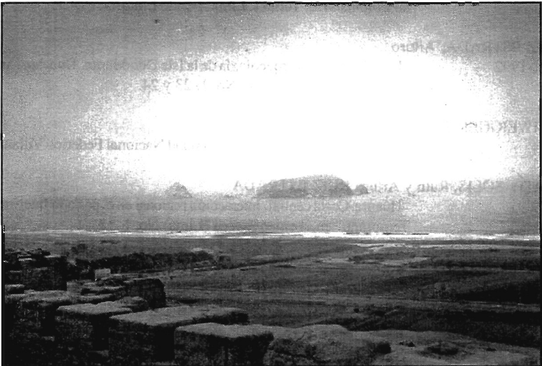
Islas de Pachacamac