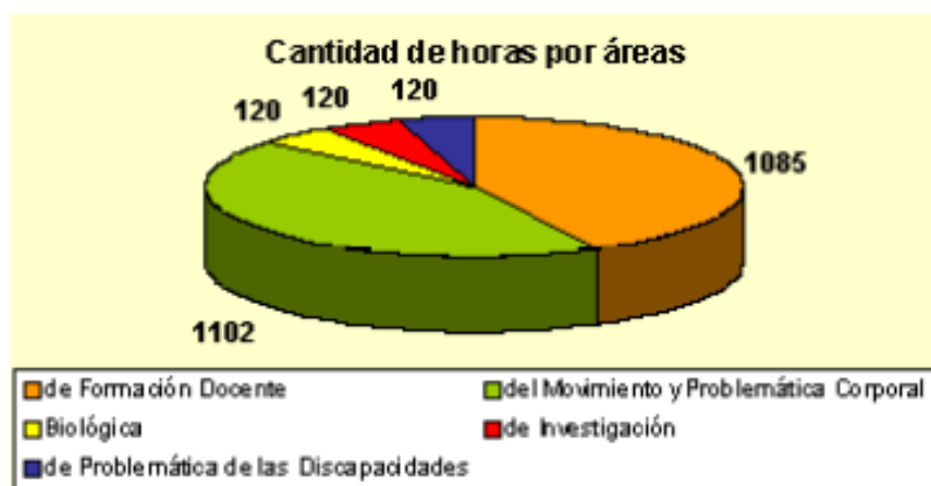
GRÁFICO N° 2 PONDERACIÓN HORARIA DE LAS ÁREAS DE FORMACIÓN DEL PLAN DE ESTUDIOS

Área de la Problemática de las Discapacidades: 2 espacios curriculares integrados por 1 asignatura y 1 seminario.