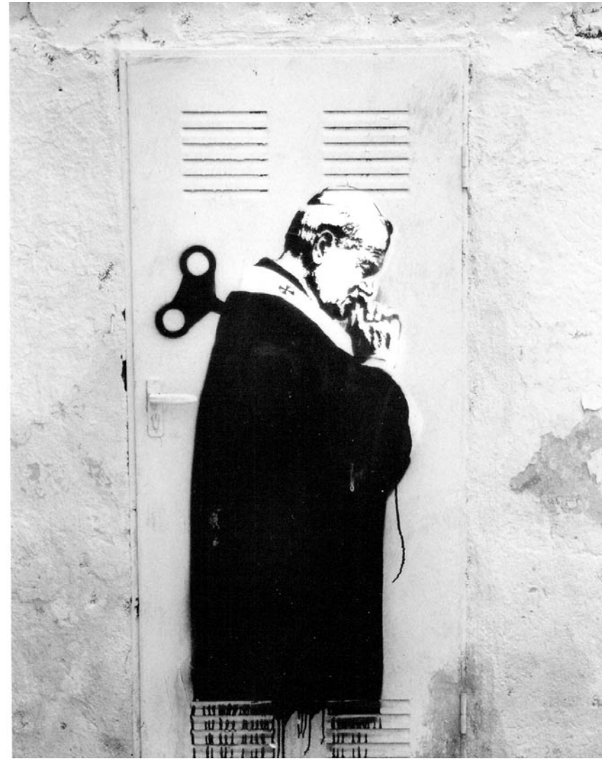
Lavapiés | Madrid.

Y Colón salió del centro del mundo partiéndolo en dos Amó a las sirenas y llegó con sus cruces embusteras adonde nadie lo invitó Un cura a latigazos hizo cortar la madera en la selva para después hacer un monumento a un Dios que de la pobreza aún no se entera Y vinieron los monstruos de metal mitad hombre mitad animal Y yo aún me pregunto ¿qué parte era la animal? Bajo el sol se masturbaron y a las indias sodomizaron para satisfacer su placer Mientras el indio se desesperaba al ver su antigua vida desaparecer