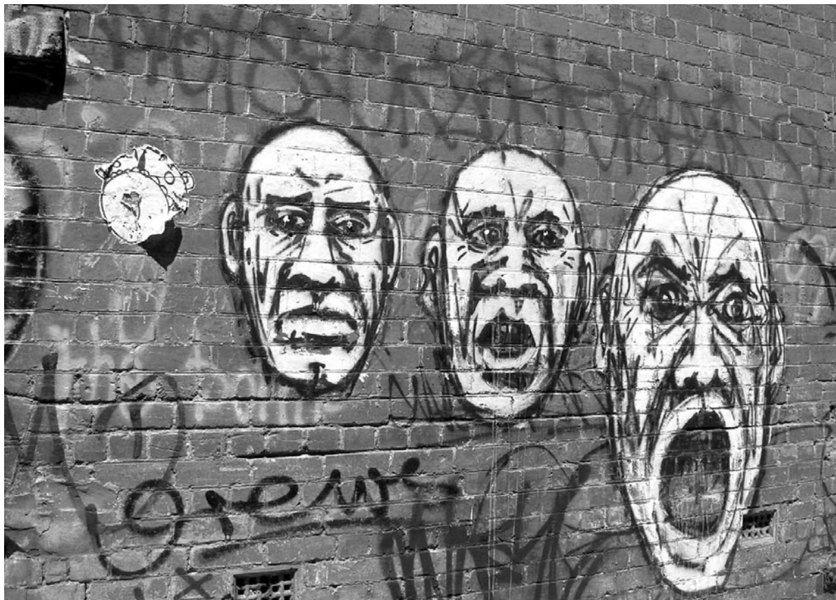
Fitzroy | Melbourne.

Me cierran la puerta en las narices no puedo hacer nada más sólo explotar ante el primer fascista que comenta «pero qué miran tanto...» ¿que qué miramos? Y le suelto que «pensaba que los días del franquismo cuando apaleaban a la gente ya habían desaparecido...» y me largo con rabia con impotencia al no poder hacer más al final de cuentas soy tan sólo una extranjera en situación irregular