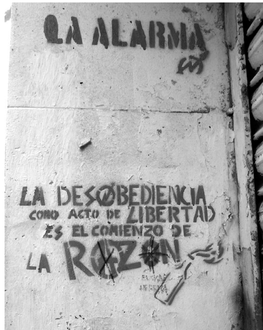
Centro Cultural La Alarma | Embajadores [Madrid].