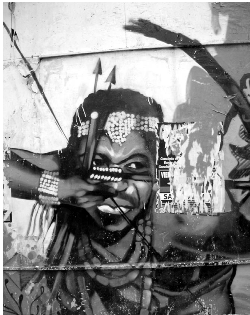
Centro Cultural La Alarma | Embajadores [Madrid].