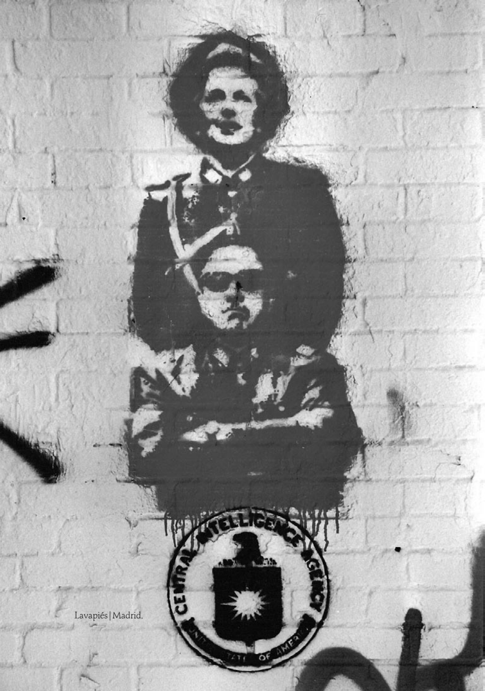
Lavapiés | Madrid.