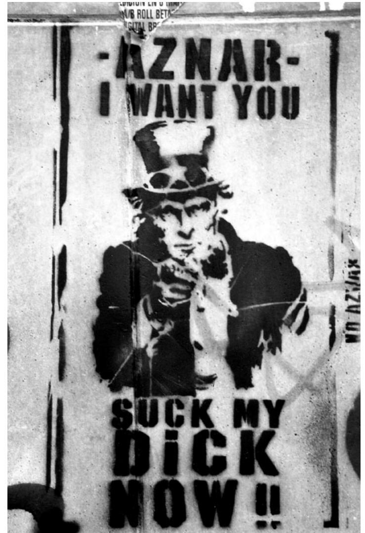
Lavapiés | Madrid.

Los iraquíes yacen en charcos rojos junto a los niños las mujeres que ellos, los malditos llaman «insurgentes»