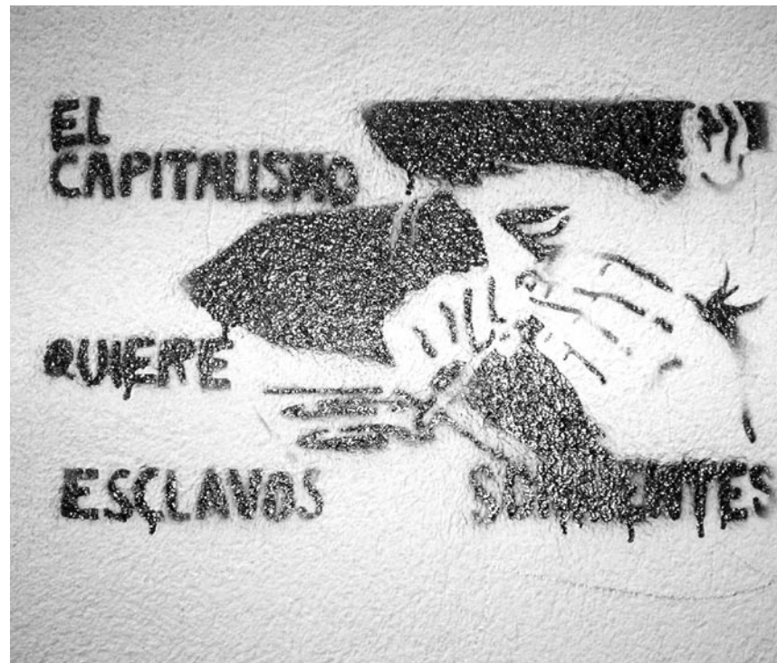
Lavapiés | Madrid.

Los transeúntes van y vienen y uno que otro turista despistado es acechado por los colgados que buscan pagarse su adicción Y la gitana corre de los municipales con sus cajas de fruta a cuestas buscando donde esconderse hasta una nueva ocasión