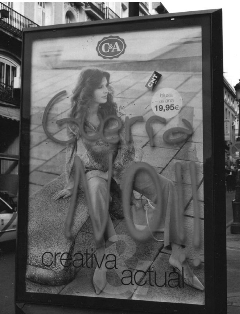
Puerta del Sol | Madrid.