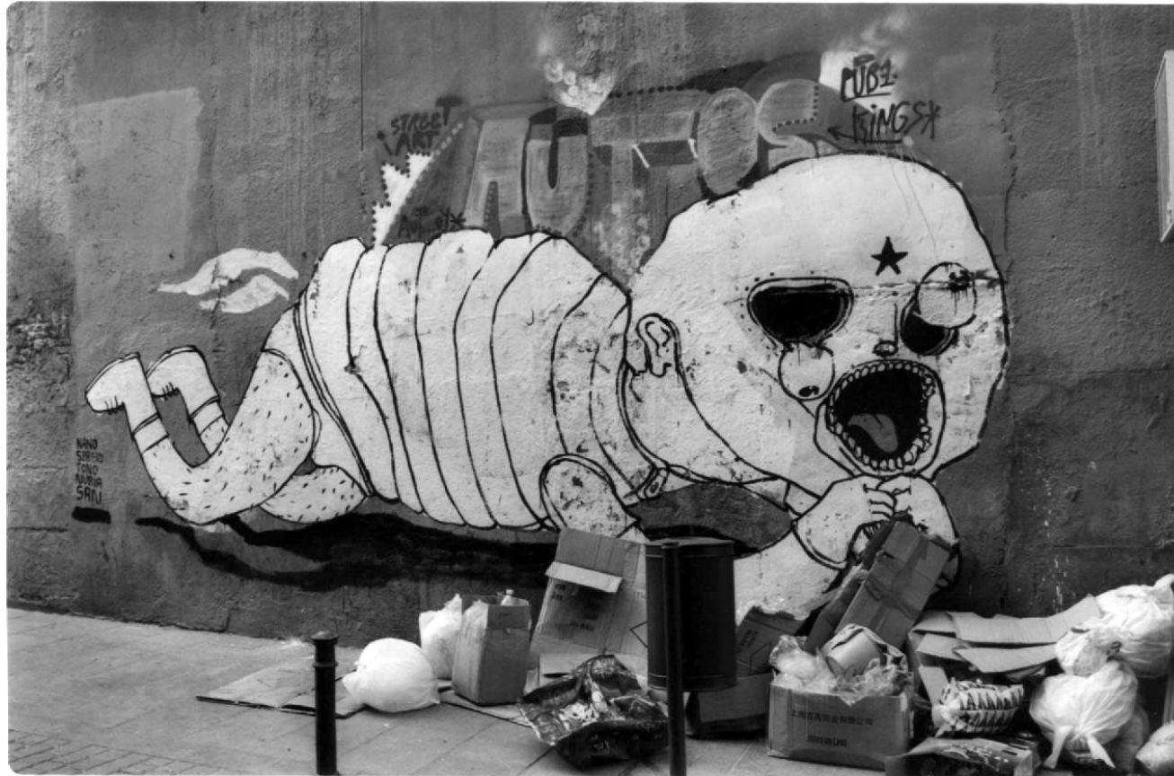
Calle Jesús y María | Lavapiés [Madrid].

cuando con tus oídos aprendas a escuchar y escuches los gemidos que se ahogan en la mar Y escuches los gritos de tu vecina a quien le han vuelto a pegar Entonces, sólo entonces podrás alardear de modernidad Españolito cuando con tus ojos aprendas a mirar y veas la gente tirada en la calle y la policía que acosa al inmigrante y los chulos que alardean de su «mercancía» en plena vía peatonal Entonces, sólo entonces, podrás hablar de humanidad Españolito cuando con tu nariz empieces a olfatear y huelas la peste a orina a la salida de cualquier bar el tufo a excremento en cualquier calle de tu ciudad Entonces, sólo entonces podrás fanfarronear de modernidad de civilización de igualdad