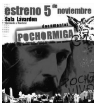
Afiche de la Presentación del Video en Rosario, 5 de noviembre del 2004.