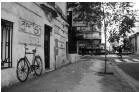
Foto: Intersecciones de las calles Boulevard Oroño y Mendoza, Rosario

Sus bicicletas estampadas se encuentran en diferentes espacios urbanos rosarinos: en cualquier esquina de barrio; en paredes del centro ciudadano; sobre el frente de escuelas; en fábricas abandonadas; en las paredes de lo que en algún momento fueron centros clandestinos de detención.