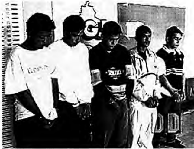
Sospechosos son capturados ante las Cámaras de Duro y Directo.