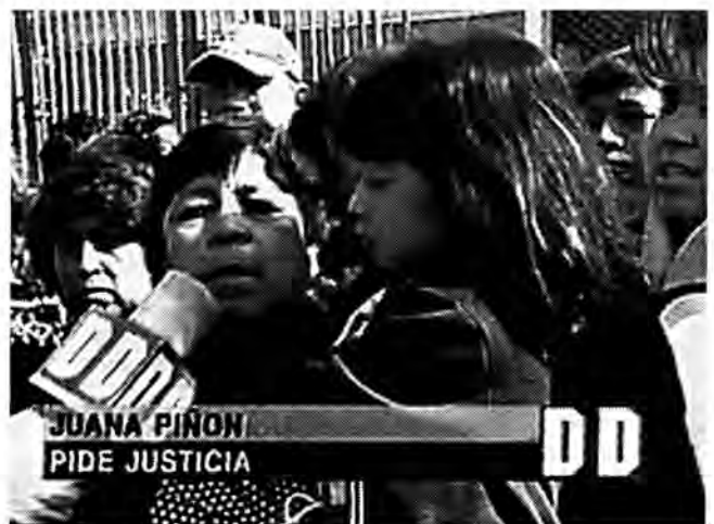
Una víctima pide justicia en Duro y Directo