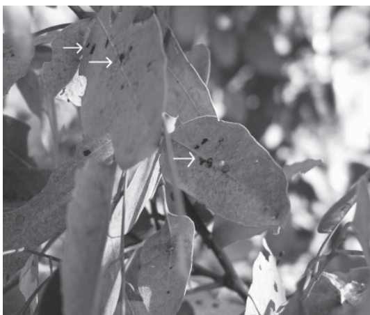
Figura 5. Posturas de Thaumastocoris peregrinus en Eucalyptus tereticornis (Las flechas indican parches de huevos).

heridas o imperfecciones de los tallos y en cápsulas. Debido a que los huevos tienen un corion engrosado de color negro, las posturas colectivas forman manchas negras, fácilmente reconocibles en los árboles atacados (Jacob y Nesar, 2005) (Figura 5). Presenta cinco estadios ninfales. Noack y Rose (2007) determinaron que el período ninfa-adulto en condiciones de 17-20 °C y fotoperíodo L:O 12:12 hs tiene una duración promedio de 20 días. En Uruguay en condiciones similares se observaron ciclos más cortos (Martínez, 2008). Las obser-