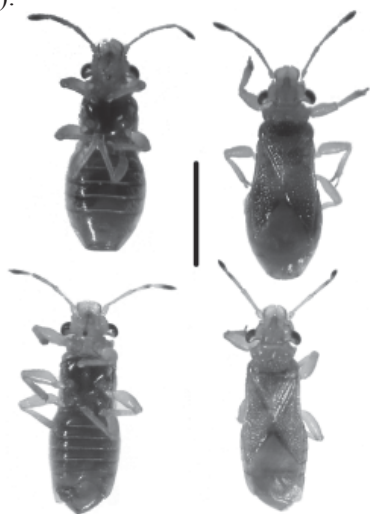
Figura 1. Aspecto general del adulto de Thaumastocoris peregrinus (la barra de referencia corresponde a 1 mm).

Diagnosis: Medidas del adulto: 2,0 a 4,0 mm de largo por 0,9 mm de ancho; cuerpo muy deprimido. Coloración general parda clara; márgenes laterales de la cabeza, borde del pronoto y de los hemiélitros más claros. Ojos de color ámbar a rojizo. Antenas de 4 segmentos, siguiendo la coloración general del cuerpo, con el ápice del tercer segmento antenal y la mitad a totalidad del cuarto más oscuro. Juga largas, excavadas y ensanchadas en la porción medial con márgenes exteriores curvos (Figura 1).