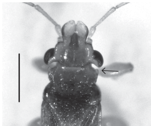
Figura 2. Adulto de Thaumastocoris peregrinus . Detalle del pronoto. La flecha indica el tubérculo pronotal característico de la especie (la barra de referencia corresponde a 0,5 mm).

Tubérculo en los ángulos anterolaterales del lóbulo anterior del pronoto que es característico de la especie (Figura 2). Tibias anteriores y medias del macho con tres dientes subapicales oscuros en el margen interior en disposición triangular (Figura 3). Mancha roja entre los tergitos 3-5 en las ninfas jóvenes correspondiente a las glándulas repugnatorias dorsales.