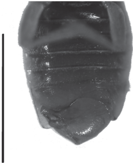
Figura 4. Macho de Thaumastocoris peregrinus . Vista ventral del abdomen (la barra de referencia corresponde a 1 mm).

heridas o imperfecciones de los tallos y en cápsulas. Debido a que los huevos tienen un corion engrosado de color negro, las posturas colectivas forman manchas negras, fácilmente reconocibles en los árboles atacados (Jacob y Nesar, 2005) (Figura 5). Presenta cinco estadios ninfales. Noack y Rose (2007) determinaron que el período ninfa-adulto en condiciones de 17-20 °C y fotoperíodo L:O 12:12 hs tiene una duración promedio de 20 días. En Uruguay en condiciones similares se observaron ciclos más cortos (Martínez, 2008). Las obser-