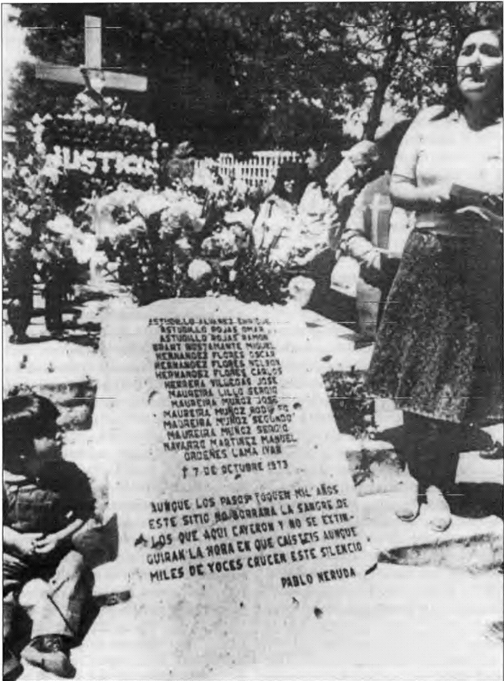
Memorial por 15 presos "desaparecidos" cuyos restos fueron encontrados en Lonquén, Chile