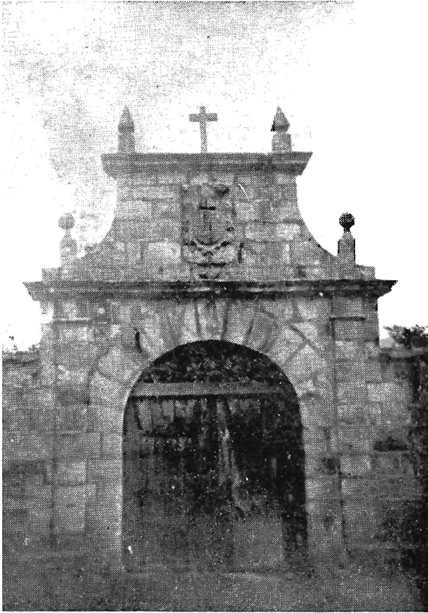
Portada de la Casa Solariega de los Bustamante en Helguera.