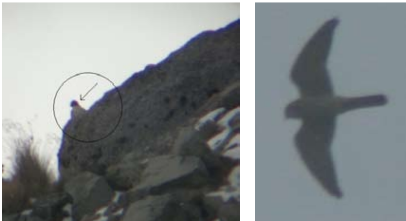
Figura 1. a. Falco peregrinus adulto perchado sobre rocas en la en la cima de la montaña. Parque Nacional La Malinche, Tlaxcala. Nótese el típico patrón negro de la “bigotera” en la cara. Y nótese la nieve entre las rocas, 19 de Enero de 2012. b. Falco peregrinus volando sobre el páramo de altura y cima de la montaña, del PNLM, 2 de Octubre de 2012.