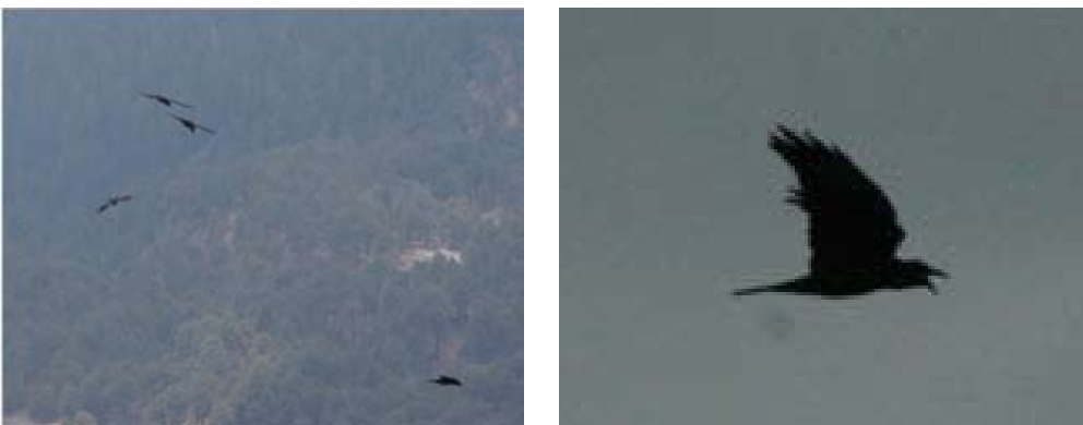
Figura 3. a. Corvus corax , cuatro individuos en vuelo en la cima y páramo de altura de la montaña, del PNLM, 24 de Julio de 2010. b. Corvus corax vocalizando sobre un tipo de bosque de pino-encino-abies en el PNLM, 1 de Noviembre de 2012.

Estos nuevos registros muestran que F. peregrinus es una especie residente del estado de Tlaxcala, al observarse en distintas zonas en distintas temporadas del año, incluida la reproductiva de la especie. F. columbarius utiliza estas zonas dentro del estado de Tlaxcala durante la temporada de otoño e invierno. Nuestros registros confirman plenamente la presencia de estas dos rapaces diurnas en el estado de Tlaxcala y en el PNLM, especies que habían sido consideradas solo como hipotéticas en este estado (Howell & Webb 1995; Fernández et al. 2007). Corvus corax había sido repor-