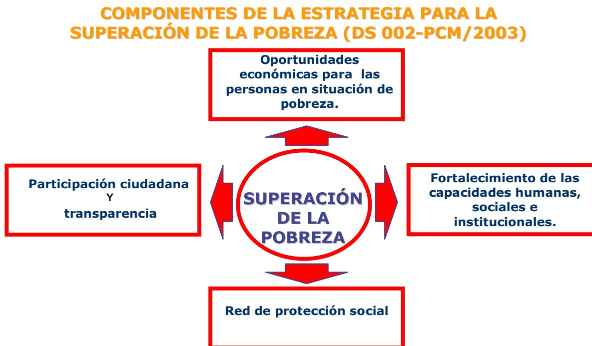
CUADRO N.º 6 COMPONENTES DE LA ESTRATEGIA PARA LA SUPERACIÓN DE LA POBREZA (DS 002-PCM/2003)

Esta renovación de la política social se basa en una extendida conciencia sobre el valor de la vida y dignidad humana y un salto en la solidaridad social vigente hacia todos los miembros de la sociedad.