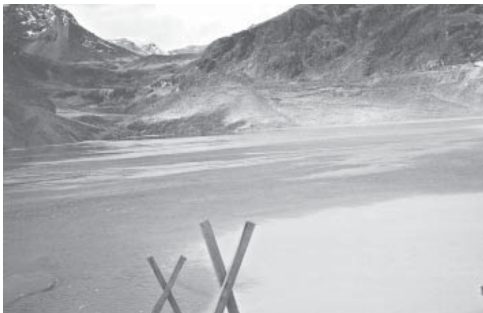
Relavera de Chinchán en la que se depositan cientos de toneladas de residuos tóxicos.