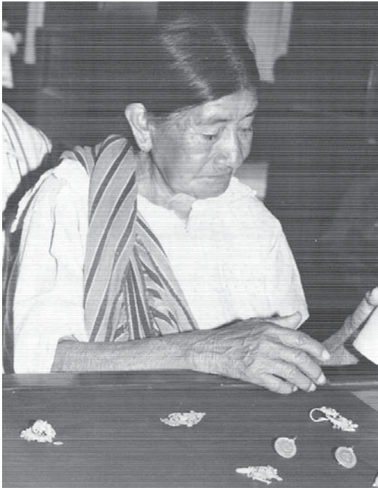
Campesina dividiendo herencia.