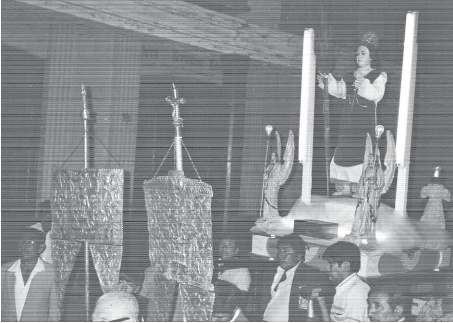
Estándares repujados por su padre en procesión.