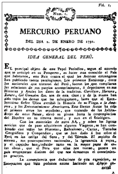
IMAGEN N° 1: Portada del primer número del Mercurio Peruano.

Por supuesto las expediciones científicas y este auge cultural no es producto de una generación espontánea, tenemos que ubicarnos en el marco de una España ilustrada, altamente influenciada por el movimiento francés, que logra un gran avance científico y cultural, que alcanza su clímax durante los años en los que ocupa el trono Carlos III, y comienza a decaer, como producto de las fluctuaciones económicas, durante el reinado de su sucesor, Carlos IV.