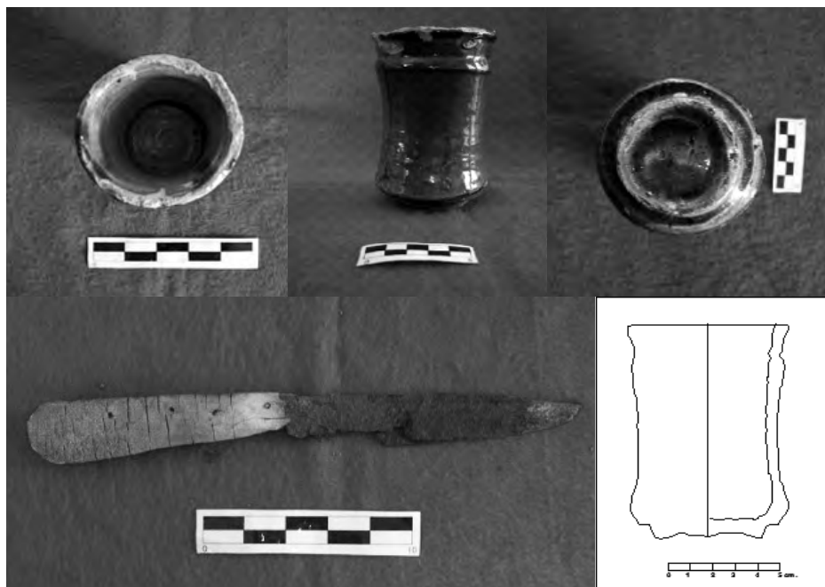
Figura 9 (Superior izquierda): Vista del vaso colonial hacia su interior. Figura 10 (Superior centro): vista de perfil del vaso. Figura 11 (Superior derecha): Vista del vaso colonial desde su base. Figura 12 (inferior izquierda): Vista del cuchillo que se encontraba debajo del vaso. Figura 13 (inferior Derecha): Dibujo del perfil del vaso.