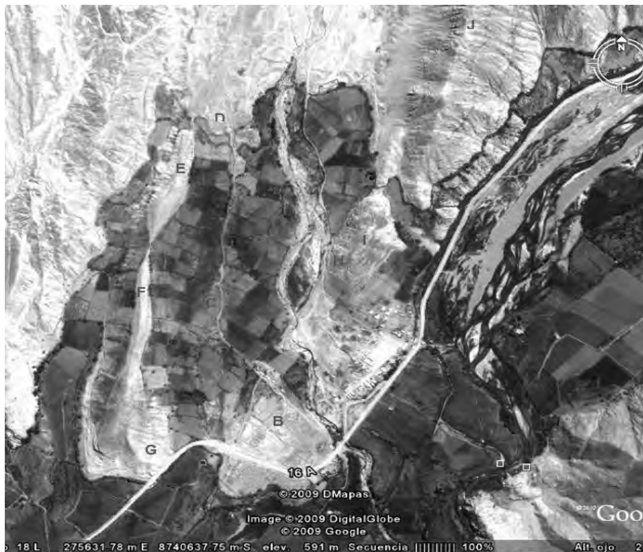
Figura 1: Vista Satelital del complejo arqueológico de Lumbra, con sus sectores integrantes.

que se dirige y se pierde hacia el Este del sector, y otra que se dirige hacia el Oeste ascendiendo por la ladera baja del cerro La Mina, para luego extenderse por toda la parte baja de este cerro, hasta perderse en la quebrada La Mina. Por otro lado, de la muralla que se extiende por todo el sector C se desprende otra que asciende hacia el Oeste, hasta juntarse con el muro perimétrico del Sector G. Las murallas que se encuentran en buen estado de conservación tienen hasta 3.50 m de alto y de 1.50 a 2 m de ancho.