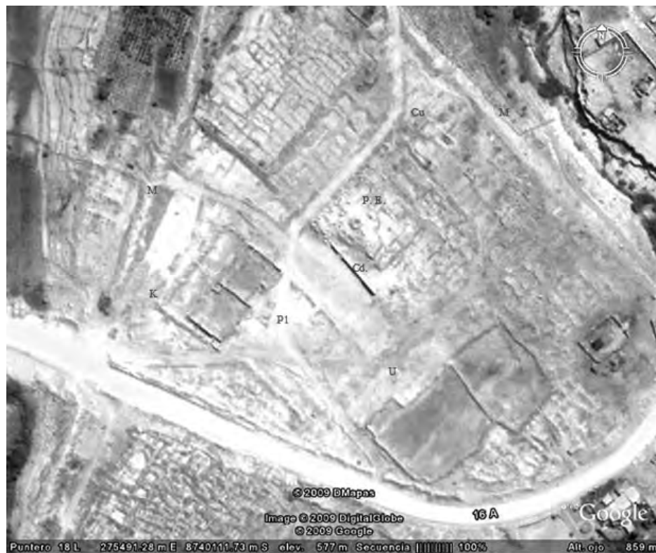
K: Kanchas. P. E.: Plataforma Elevada. Pl: Plaza. U: Ushnu. Cd: Cuadrilátero. M: Muralla 1. Cu: Cúpula.