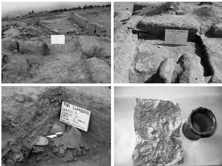
Figura 5 (Superior izquierda): Unidad 11 al inicio de la excavación. Figura 6 (Superior derecha): Unidad 11, Piso 1. Figura 7 (inferior izquierda): Hallazgo del vaso colonial, unidad 11, capa B. Figura 8 (inferior derecha): Vista del vaso colonial, con el documento que contenía en su interior.

Piso 1: Es de color beige claro, de 0.08 a 0.10 m de grosor, hecho de tierra entremezclada con piedrecillas menudas, de consistencia semicompacta. No presenta revoque, ni asociación directa a muro alguno. Se trata de un piso simple, hecho para cubrir la capa B y el hallazgo 1, los cuales datan del período colonial temprano (inicios del siglo XVII). Sobre el piso se halló algunos fragmentos cerámicos disturbados, que se encontraban formando parte del relleno de la capa A. En el lado Este de la unidad el piso se encontraba ligeramente deteriorado.