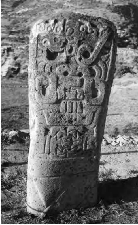
El doctor Tello y su equipo descubrieron Kunturwasi, Cajamarca.