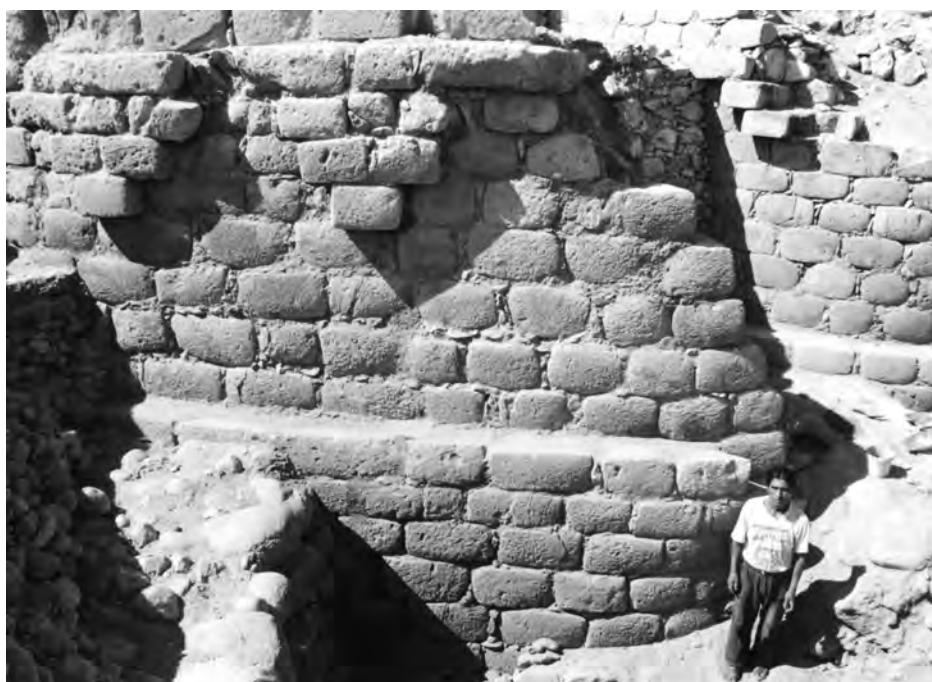
Tumshukayko. El gran muro A y el gran muro B con los triángulos escalonados bajo cornisa. Excavaciones arqueológicas de 2003.