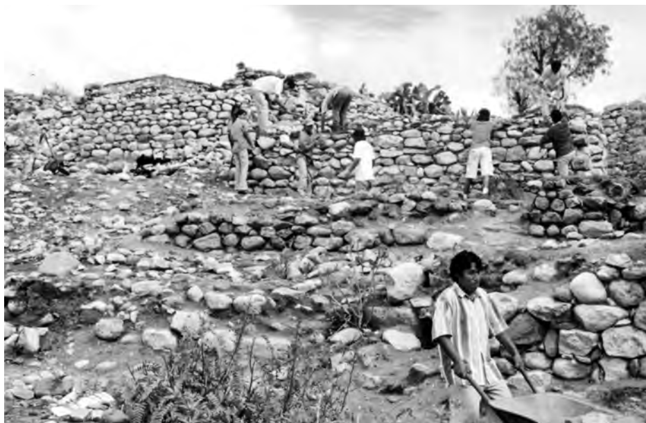
Tumshukayko, sitio visitado por Tello en 1919. Alumnos de San Marcos contribuyen a despejar el monumento de 14 casas particulares, 2003.