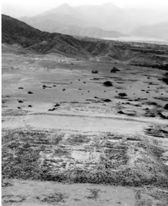
La gran pirámide de Taukachi, margen derecha del río Sechín, registrada por el doctor Tello, 1937.