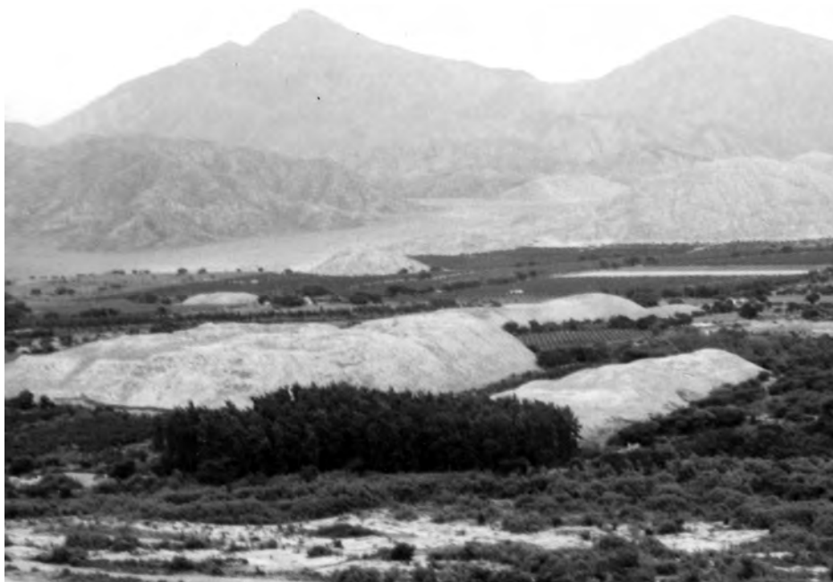
El doctor Tello registró el gran sitio de Sechín Alto al que consideró uno de los monumentos más grandes del Perú, 1937. Notar su planta en «U».