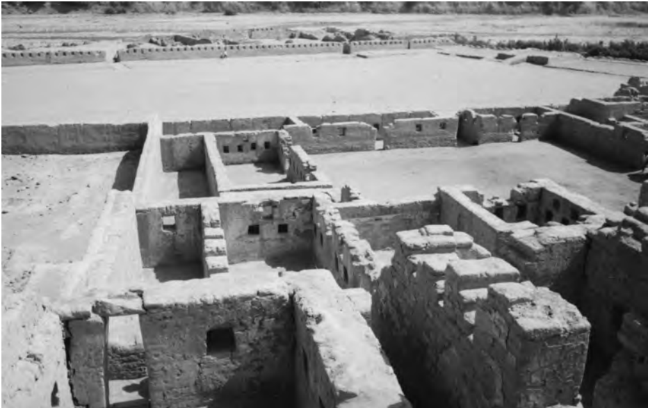
El doctor Julio C. Tello rescató, estudió y conservó Tambo Colorado, Pisco.