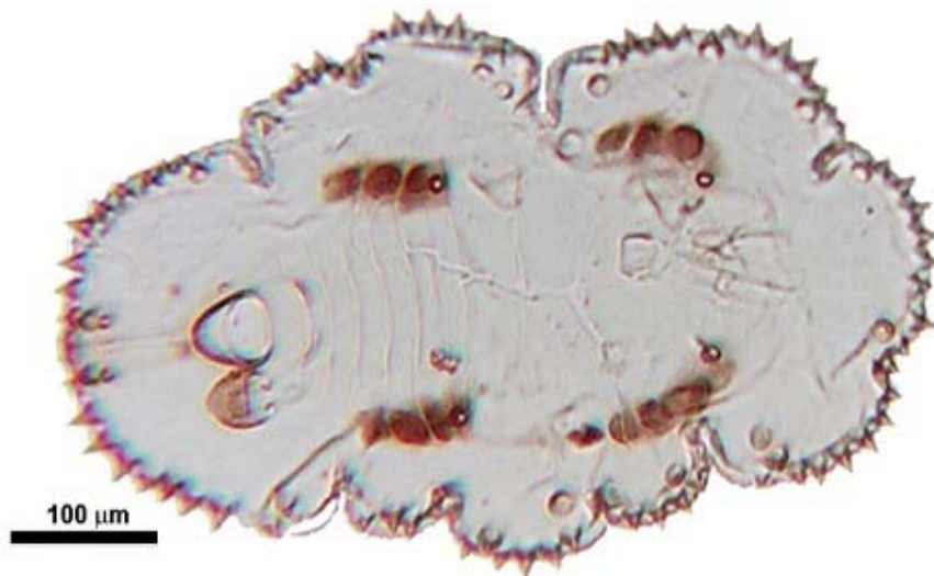
Figura 2 Fotografía de Trialeurodes quintanarroensis sp. nov.