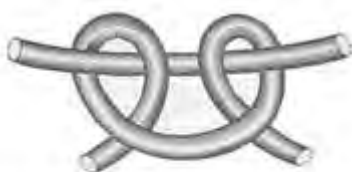
Figura 1. Nudo de vaca o nudo de cabera de alondra.