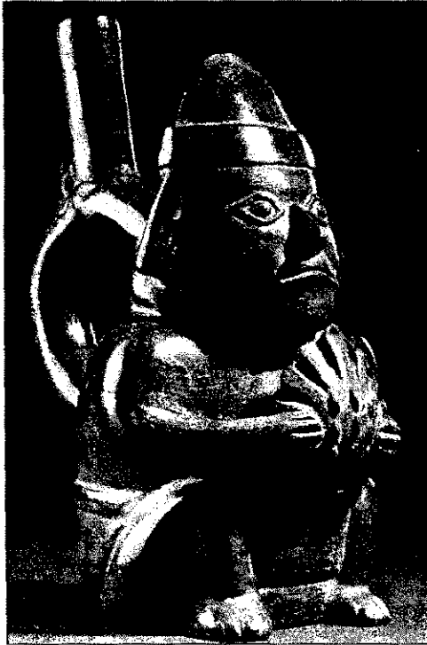
Figura 5. Ceramio Chimú, con representación de un personaje que sostiene una valva de Spondylus sp.

la presencia de spondylus (véase Tabla 1 ). En cambio, en yacimientos arqueológicos de la costa sur se ha registrado escasa presencia de este molusco tropical.