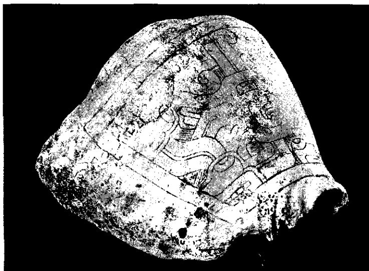
Figura 6. Caracol marino de la especie Strombus galeatus con decoración incisa. Presenta perforación circular en el extremo inferior del labio, próximo a la «boca» (estoma) del caracol. Fue recuperado en las excavaciones de una tumba del sitio de Kunturwasi.

En las excavaciones realizadas en el sitio arqueológico de Armatambo (Díaz, com. pers. ), se ha podido identificar tres ejemplares de Conus fergusonii , ubicados en el relleno que cubría una tumba disturbada.