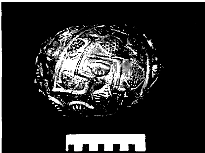
Figura 3. Ceramio Chavin, proveniente de la Galería de las Ofrendas del Templo Viejo. Presenta conchas de mullu y pututo, modeladas en relieve (Colección MAA-UNMSM).