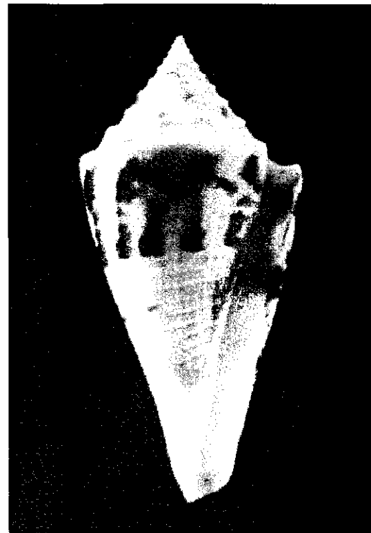
Figura 2. Gasterópodo de la familia Strombidae, conocido como «Cono». Todas las especies de este género son tropicales. Una de sus características más importantes es su colorido.