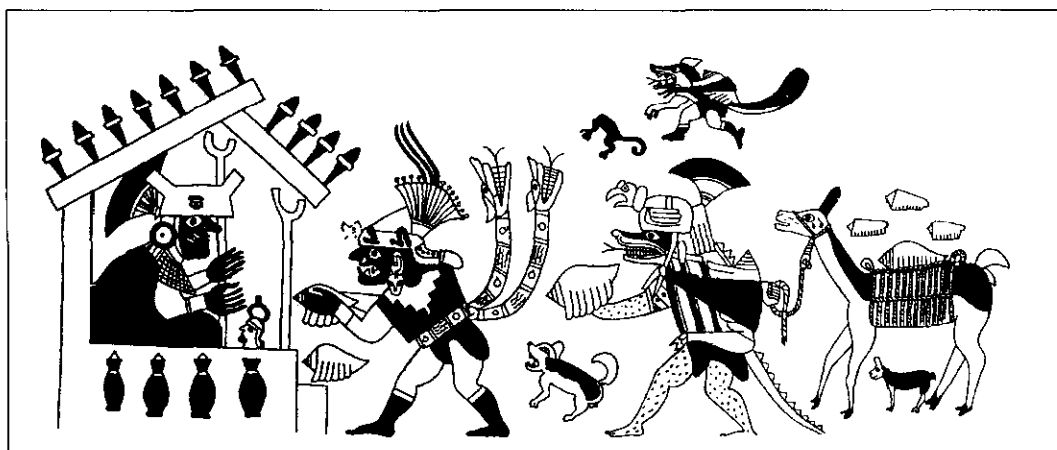
Figura 4. Representación de un señor Moche recibiendo como ofrenda las conchas de los moluscos Strombus galeatus y Conus fergusonii .

En los sitios arqueológicos de Lauri, Pasamayo y Puerto Chancay (valle de Chancay), se han identificado en superficie fragmentos de Spondylus princeps (Vidal, 1969; Horheimer, 1963). Hay un mayor número de sitios en los valles del Rímac y Lurín con