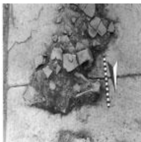
Foto 3. Fragmentos de cerámica sobre bloques de piedra plana.