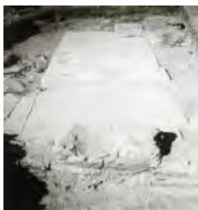
Foto 1. Bloques de piedra plana.

Recientemente se realizó excavaciones arqueológicas en Marayniyoq, sitio de la época Wari, ubicado en el valle de Ayacucho (fig.1). Dichos trabajos fueron conducidos para evaluar la función de un grupo de bloques de piedra plana, encontrados en posición horizontal, que fueron expuestos por un tractor en circunstancias que se venía removiendo terrenos hasta entonces no explotados para la agricultura.