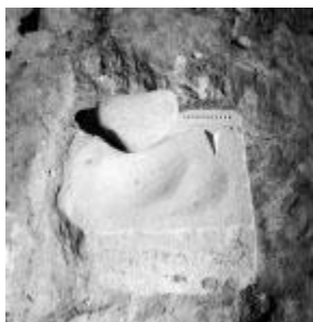
Foto 4. Piedra plana rectangular con una depresión.

Apenas se han inaugurado los estudios en Marayniyoq, y los datos iniciales indican que el referido sitio fue único en su carácter. Viendo esta particularidad, nuestro programa de investigaciones tiene planeado continuar con dichos estudios. Sólo en la medida del avance de tales trabajos podremos confirmar si, en efecto, Marayniyoq fue un centro especializado destinado al procesamiento de granos y productos similares, y sólo así podremos discutir el rol de Marayniyoq dentro del complejo desarrollo de la cultura Wari.