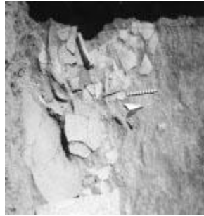
Foto 1. Bloques de piedra plana.