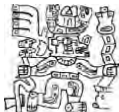
Deidad de los báculos, estilo Conchopata, Wari.

1979 Quechua: Manual de enseñanza . I.E.P., Lima.