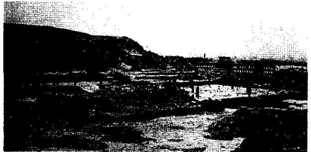
HUACA SAN MARCOS DE LA CIUDAD DE MARANGA

Fue una época de bonanza e intensas relaciones con otras sociedades coetáneas. Hacia los 450 años d. C. se edificó la gran urbe de Cajamarquilla en el valle medio del Rímac, una de las más extensas y complejas del Perú Prehispánico, que va desapareciendo sin que haya sido conocida siquiera por la mayoría de los pobladores actuales de Lima.