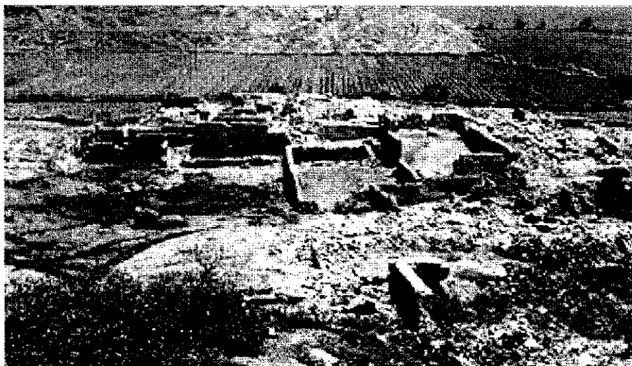
CONJUNTO DE HUAYCÁN DE PARIACHI

Después de un tiempo de recomposición social, las poblaciones de los valles del Rímac y Lurín continuaron bajo la hegemonía política y cultural de la organización estatal Lima.