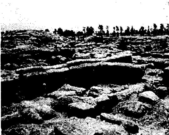
CIUDAD DE CAJAMARQUILLA

Con una economía próspera, durante la Época 1, las sociedades de Lima participaron de la esfera de fuerte interacción establecida en los Andes Centrales, que integró a poblaciones de costa, sierra y selva del norte, centro y sur del Perú. Las ciudades de Cajamarquilla, Maranga y otras florecieron, se remodelaron sus construcciones y los especialistas elaboraron objetos exquisitos. Alcanzó gran prestigio el estilo Nievería.