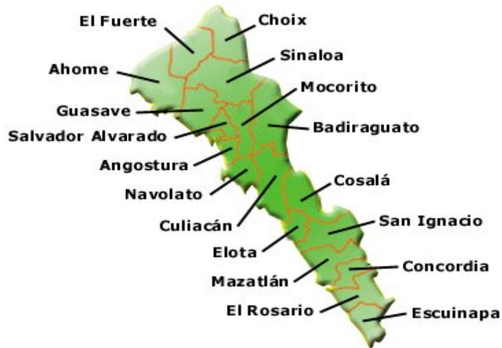
Figura 2: municipios actuales del estado de Sinaloa