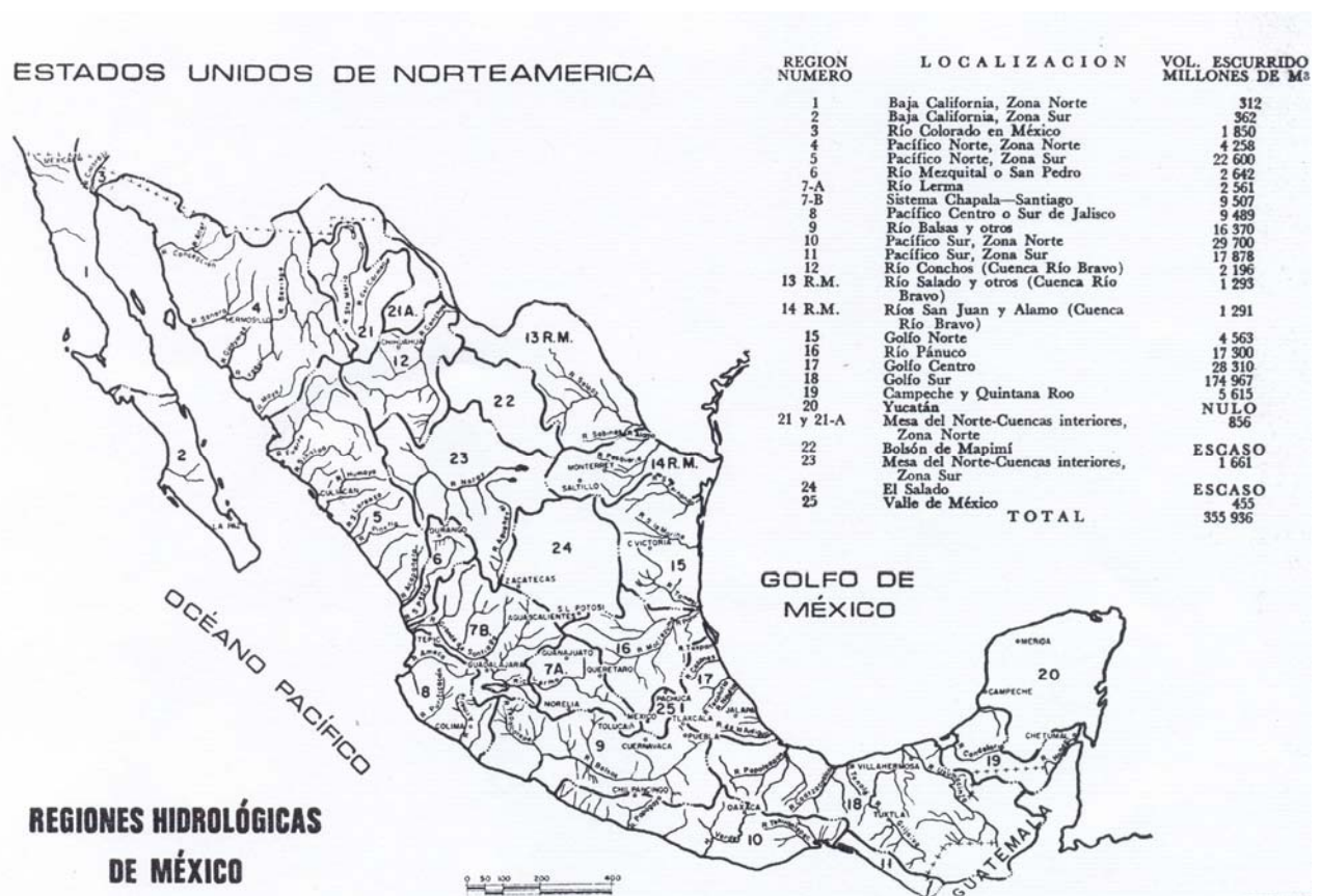
Figura 4: Regiones hidrológicas de México

Fuente: NAVARRETE, I. M. de (1971): Bienestar campesino y desarrollo económico, México, Fondo de Cultura Económica, p. 96