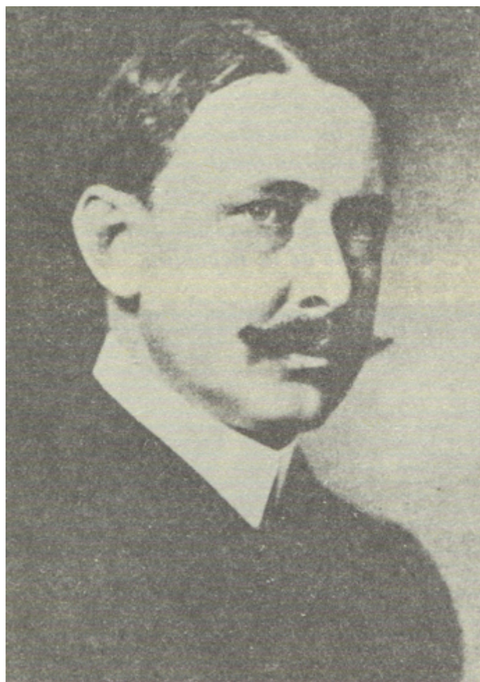
Figura 8: Retrato del general Francisco Cañedo