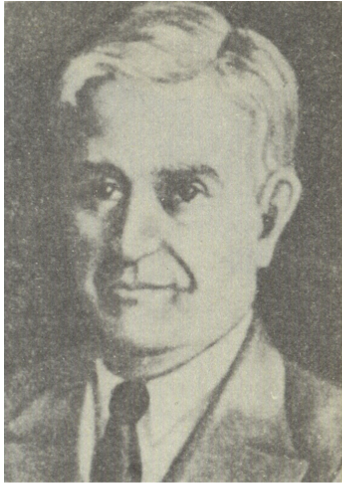
Figura 10: Retrato