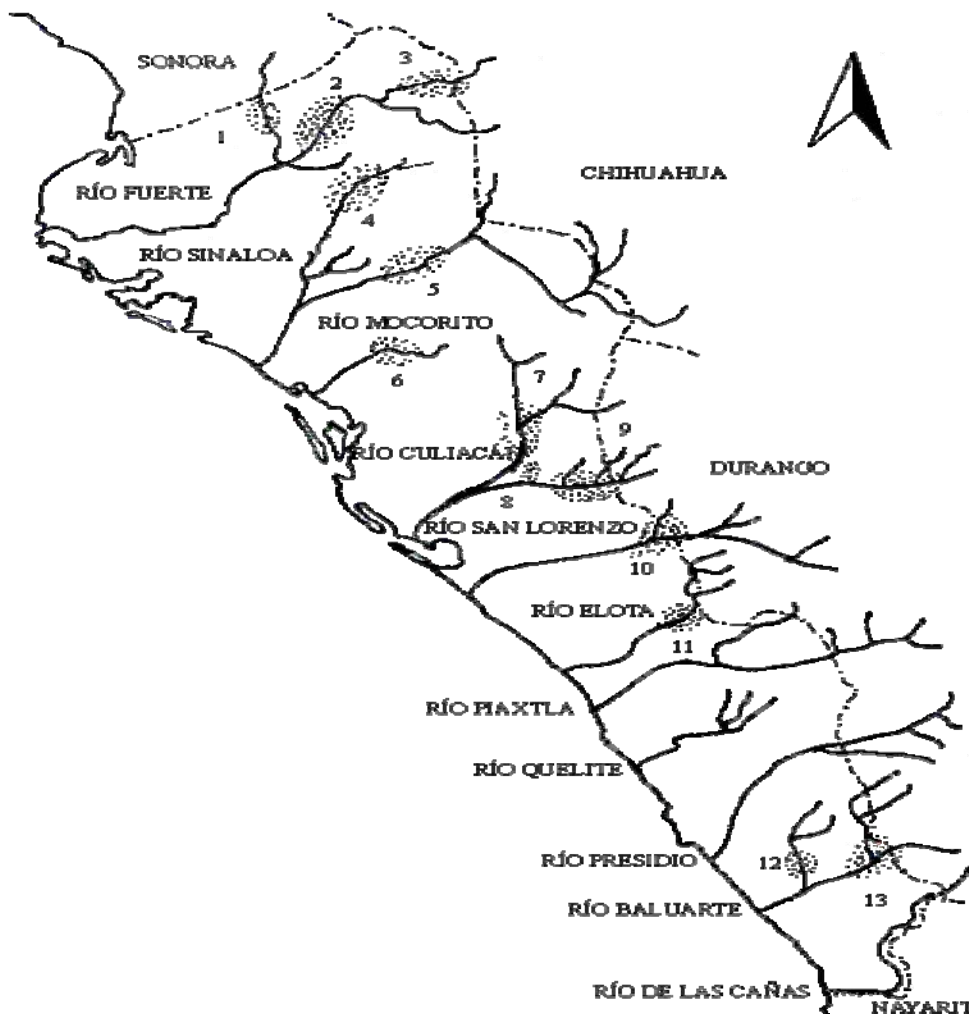
Figura 3: los once ríos de Sinaloa y sus presas en la actualidad