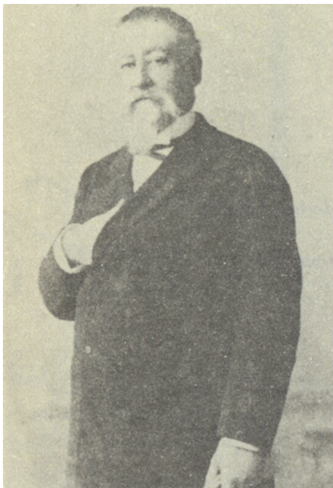
Figura 7: Retrato de don Joaquín Redo y Balmaceda