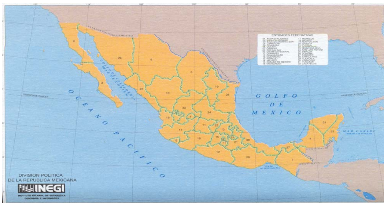
Figura 1: Mapa de México