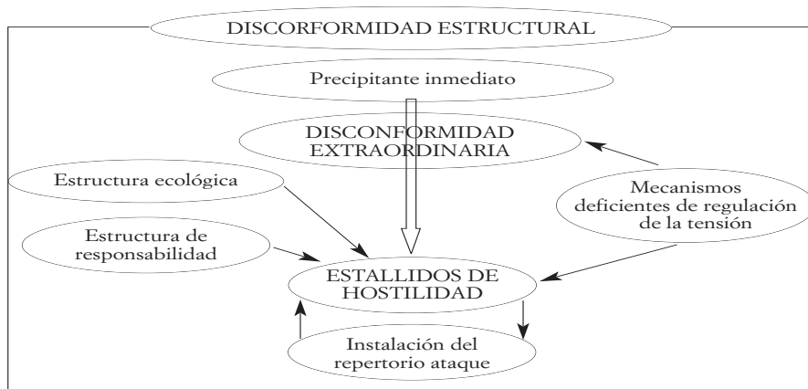
ESQUEMA I MAPA CONCEPTUAL DE LOS FACTORES ESTRUCTURANTES DE LOS ESTALLIDOS DE HOSTILIDAD. CONTEXTO POLÍTICO-CULTURAL

En el siguiente mapa conceptual se formalizan las principales relaciones involucradas en la génesis y desarrollo de estos estallidos de hostilidad: