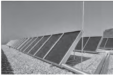
Figura 6. Arreglo de paneles fotovoltaicos para energía alternativa en los edificios

eléctrica, energía geotérmica, mini-hidráulica e incluso energía nuclear.