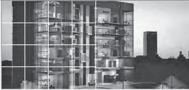
Figura 4. Sistemas automatizados en edificios. Tecnologías ambientales para la construcción de edificios

artificial, ahorro en energía, control de equipo e instalaciones electromecánicas, eléctricas y electrónicas, por medio de dispositivos “inteligentes” de control; lo cual ayuda, además de reducir el impacto ambiental causado por el edificio, a aumentar el confort al interior del mismo. En general, este sistema ayuda a otros subsistemas de instalaciones (Figura 4) a funcionar de manera adecuada.