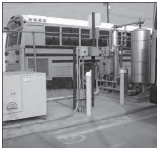
Figura 2. Subestación de gas natural para transporte urbano sustentable.