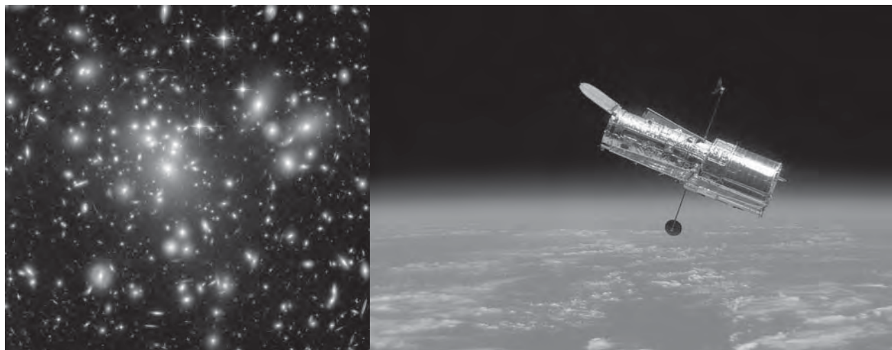
Figura 2. Al mirar las imágenes tan impresionantes (Cúmulo de Abell, izquierda) obtenidas por el Telescopio Espacial Hubble (derecha), no se puede evitar que venga a nuestra mente de nuevo la pregunta milenaria: ¿de qué está hecho el Universo?

A partir del descubrimiento de la expansión acelerada del Universo, se cayó en la cuenta de que la Materia Oscura debía estar compuesta de al menos dos tipos generales de nueva materia: la Materia Oscura Fría (Cold Dark Matter, CDM, por su nombre en inglés), que formaría las galaxias y en general la estructura cosmológica que hoy observamos, y la Energía Oscura (Dark Energy, DE, por su nombre en inglés) que sería la responsable directa de la expansión acelerada del Universo (Peebles, 1993; Padmanabhan, 1994; SCP, 2009; Perlmutter, 2003; LAMBDA, 2009).