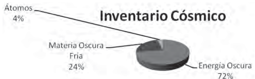
Figura 1. El llamado "Pay Cósmico", que representa de manera gráfica las porciones materiales atribuidas a nuestro Universo por la Cosmología moderna. Según estimaciones, el 96% está formado por la Materia Oscura Fría y la Energía Oscura, materias de naturaleza desconocida.

Las observaciones sobre supernovas tipo Ia cerraron un primer capítulo importante de la Cosmología en el que la pregunta central es: ¿De qué está hecho el Universo? Podemos decir que los esfuerzos de la humanidad para contestar esta interrogante han estado presentes a lo largo de toda su historia. Sin embargo, una sorpresa fue develándose poco a poco a lo largo del siglo XX y para 1998 se había convertido en una certeza: la mayor parte del contenido material de nuestro Universo observable (96% del total) está hecho de materia aún desconocida para la ciencia. Este es el acertijo central de lo que se venía llamando de manera genérica como el problema de la Materia Oscura (Dark Matter, según su denominación en inglés), ver la figura 1 y 2.