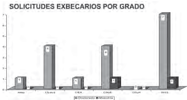
Figura 3. Solicitudes de apoyo PROMEP de exbecarios por Grado (2001-2005)

En la Figura 3 se presenta la información relacionada con los grados académicos de los ex becarios PROMEP de la Universidad de Guanajuato que han solicitado apoyo (PROMEP) desde el inicio del programa en 2001 al 2005.