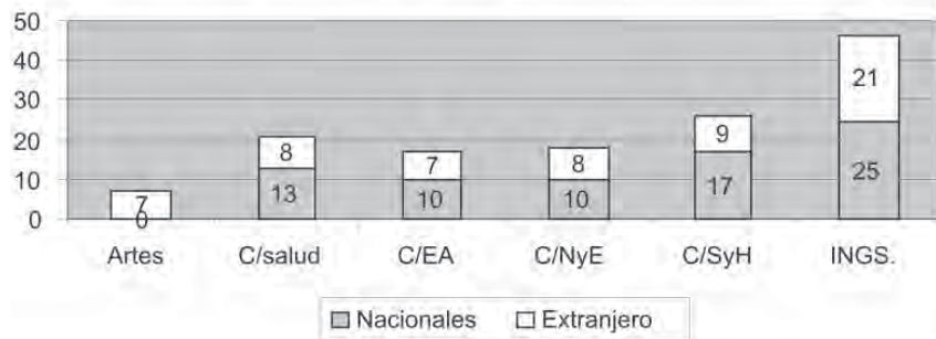
Figura 2. Porcentaje de becas otorgadas por tipo de programa: Nacionales y del Extranjero