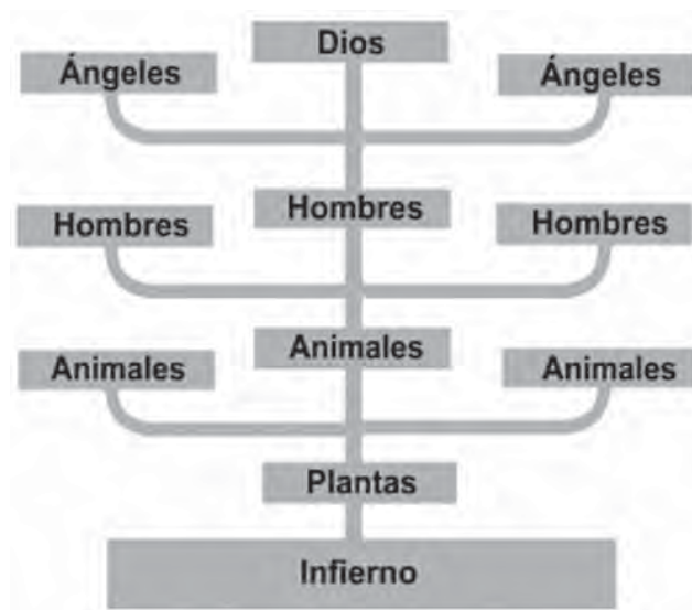
Figura 4. Esquema de la jerarquía espiritual del grabado de Valadés con forma de candelabro.

Y el viejo doctor tenía razón. Permitir que las interpretaciones consagradas se impongan indefinidamente en nosotros por culpa de nuestra apatía -que indudablemente es peor que la pereza- desdice del trabajo del historiador no de hoy ni de ayer, sino del que se viene predicando como indispensable hace ya más de medio siglo en México y al cual por desgracia, todavía no encontramos con la frecuencia que quisiéramos dentro del gremio. Por nuestra parte, con O’Gorman y con el creciente número de historiadores críticos de nuestro tiempo, estamos convencidos de que ya es hora de dejar de completar con detalles las explicaciones canónicas por temor a levantarle un poco el oropel a las grandes figuras de nuestra disciplina (que no por eso serán menos grandes), y rehacer desde abajo todo aquello que consideremos necesario para la comprensión de nuestro pasado. Para ello, por supuesto, es necesario echar mano del material acumulado y laboriosamente procesado por los investigadores que nos precedieron, pero es todavía más necesario evitar dejarnos dominar ciegamente por él. La crítica historiográfica debe ser, sin duda, una actitud siempre