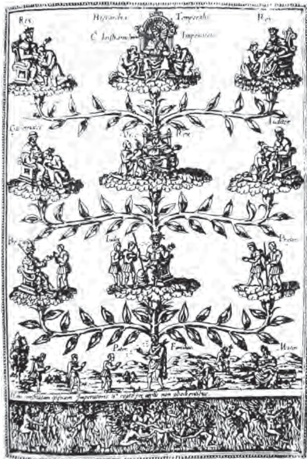
Figura 3. Árbol de la jerarquía temporal. Grabado Diego Valadés, Retórica Cristiana.

vertir momentáneamente con engaños, pero no alterar en su forma ideal.