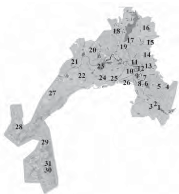
Figura 1. Ubicación de los sitios de muestreo en la ciudad de Guanajuato.

Con las condiciones instrumentales establecidas, se llevó a cabo el proceso de calibración, utilizando como estándares internos ^{74}\text{Ge} y ^{193}\text{Ir} (ambos 1,0\text{ }\mu\text{g l}^{-1} ). Las soluciones de calibración conteniendo cinco niveles de concentración para cada uno de los elementos (0; 0,2; 1,0; 5,0; 10; 25\text{ }\mu\text{g l}^{-1} ) fueron obtenidas diluyendo el estándar medio ambiental (Agilent Technologies). En la calibración multielemental, se obtuvieron los valores de coeficientes de regresión lineal r^2 > 0,9993 para cada uno de los elementos.