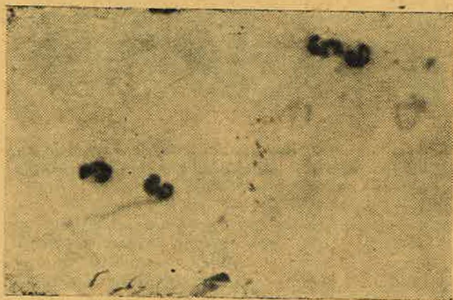
Gérmen de la Viruela. — Aparece cuatro núcleos de leucocitos y en el centro unos delicados bastoncillos con un espacio claro en el centro.

Con ser tan vieja esta enfermedad, su causa, nunca fué satisfactoriamente esclarecida. En el curso de la era microbiana, le han asignado como sus agentes, muchos gérmenes, hasta llegar a pensar, que era ocasionada por un virus imperceptible, por un ultravirus, que los medios actuales eran incapaces de revelar.