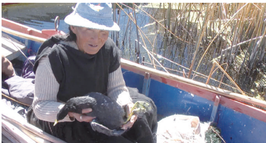
Mujer iruhito uru mostrando una chhoqa.

La caza se realiza mediante dos modalidades: de manera individual y colectiva. La caza individual se realiza persiguiendo con bote a las aves y ellas por cansancio se dejan coger. Normalmente, este tipo de caza se desarrolla cuando las aves están cambiando de pluma. Mientras que la caza colectiva se realiza entre 8 a 20 personas y se desarrolla mediante trampas con redes y mallas que son colocados en el agua y en lugares específicos. Las personas se organizan y una vez colocada las trampas, arrean a las aves por los costados para que caigan en la trampa, la misma que es construida con mallas.