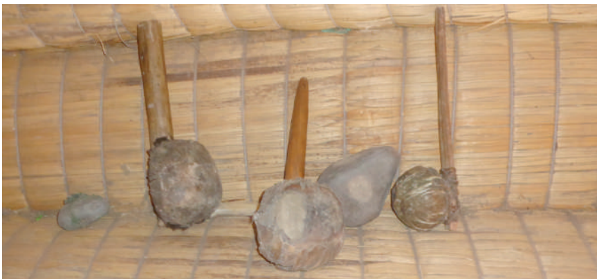
Herramientas para la construcción de las balsas.

Otro elemento importante para la construcción de la balsa es el hilo grueso o pita que es de nylon; con este hilo se amarra la totora seleccionada por cilindros o marqas ; estos cilindros se los junta dando forma de una balsa. Los instrumentos que se usan en el proceso de construcción de la balsa son el gancho ( waxlala ), cebo ( liki ) y piedra para tesar. Normalmente, los responsables de la construcción de las balsas son las personas mayores y éstos pueden ser colaborados por sus esposas e hijos.