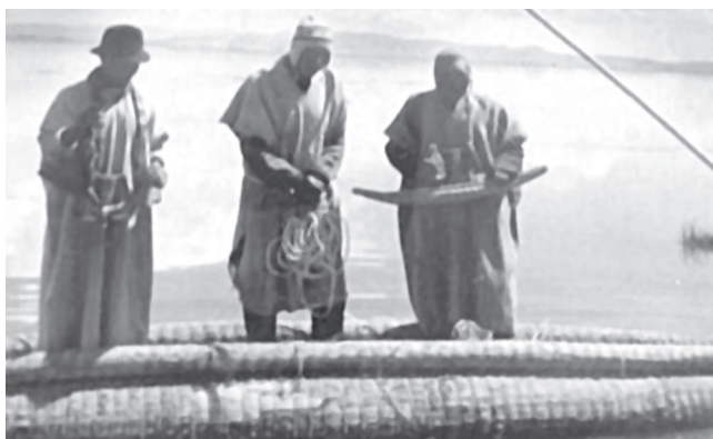
Iruhito urus en el periodo republicano.

Otra peculiaridad que señalan los cronistas es que los que estuvieron establecidos en Chucuito, que en la actualidad corresponde al territorio peruano y donde formarían parte los Iruhito Urus, “son guerreros, altivos y rebeldes”; mientras que los que estaban en Aullagas, actualmente territorio boliviano, “son nobles, sumisos y pastoriles”. Esta diferencia, entre otras razones, se debe probablemente a que los de Chucuito se encuentran mucho más aislados que de los Aullagas; además, los primeros, por encontrarse en sitios de mayor profundidad del lago, habrían desarrollado mayores estrategias militares (Velasco 2009: 21) para defenderse y, de esa manera, mostrar resistencias a todos los procesos de opresión y sometimiento.