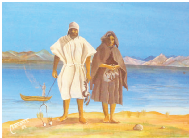
Vestimenta típica de los Iruito Urus.