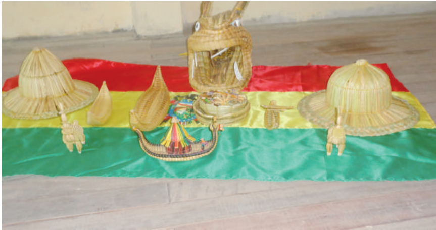
Productos artesanales elaborados con la totora.

Otro elemento importante para la construcción de la balsa es el hilo grueso o pita que es de nylon; con este hilo se amarra la totora seleccionada por cilindros o marqas ; estos cilindros se los junta dando forma de una balsa. Los instrumentos que se usan en el proceso de construcción de la balsa son el gancho ( waxlala ), cebo ( liki ) y piedra para tesar. Normalmente, los responsables de la construcción de las balsas son las personas mayores y éstos pueden ser colaborados por sus esposas e hijos.