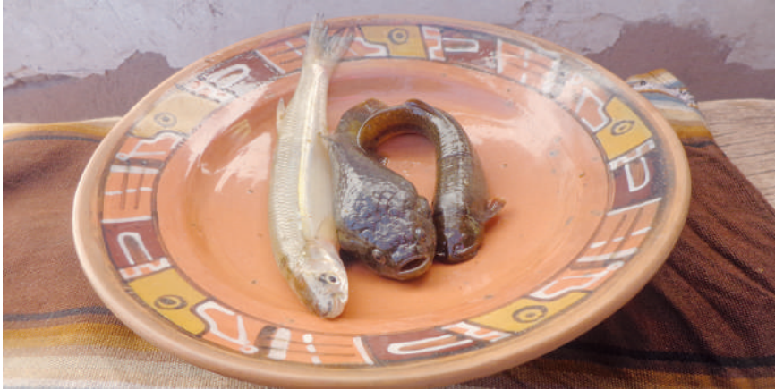
Variedad de peces en el Río Desaguadero.

Los peces más comunes y que más pescan son el qarachi , el amarillo y el pejerrey. Hace muchos años, se podía pescar las especies nativas qhesi , boga , such'i , qañu y k'uli , éstos desaparecieron como consecuencia de la introducción del pejerrey. Más de la mitad de la producción lo comercializan en el mercado regional y de las ciudades de El Alto y La Paz y el restante lo destinan a la alimentación familiar. Así mismo, mencionan que una significativa proporción que se la destinada a la comercialización lo usan en el trueque para acceder, de esa manera, a la papa, chuño, verduras y los productos de abarrote como el azúcar, el arroz y el fideo (Entrevista focal. Iruhito Urus, abril de 2014).