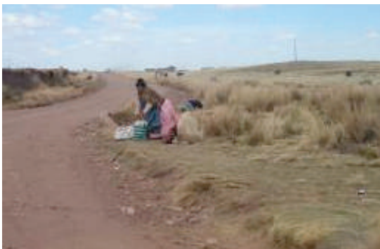
Mujer iruhito uru esperando movilidad para desplazarse a la ciudad de La Paz.