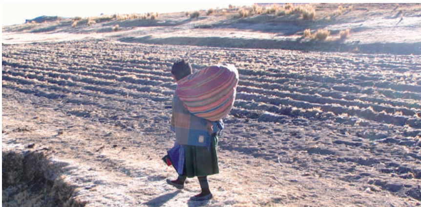
Señora iruhito uru luego de las actividades agropecuarias.

En la comunidad la mayoría de las familias tienen ganado ovino, en promedio 10 cabezas, y vacuno, en promedio 4 cabezas. El ganado es considerado como caja de ahorro porque recurren a la venta en caso de necesidades y urgencias familiares. Esta realidad de escasos recursos económicos obliga a que muchos padres de familia y jóvenes migren a otros lugares para que, de ese modo, accedan a recursos económicos que les permita mantener a los miembros de la familia que viven en la comunidad.