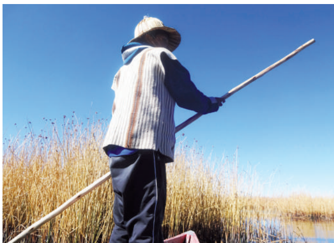
Niño iruhito uru en la recolección de huevos.

La recolección de huevos es de responsabilidad de los padres y de los hijos y, habitualmente, una familia lo realiza una vez por semana. Cada que se realiza esta actividad se logra recoger, en promedio, 80 huevos; una mayoría de dichos huevos son de choqa.