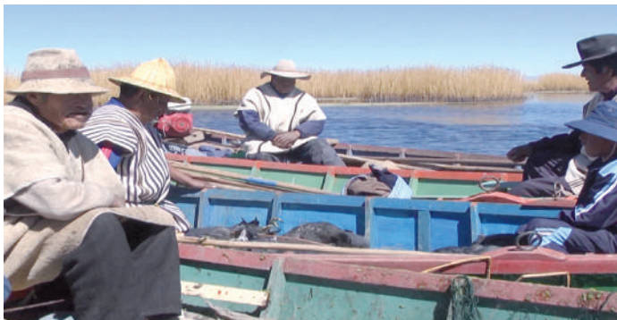
Distribución de las aves cazadas.