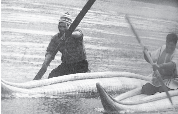
Adultos en balsas de totora.

Los pueblos Uru Murato, Chipaya, Iruhito y Chulluni, este último ubicado en el Departamento de Puno del Perú, en un encuentro realizado el 2004, acordaron denominarse como Qhas qut suñi urus que traducido al castellano significa Gentes de las aguas y hombres de los lagos . Asumieron este nombre porque, según ellos, el denominativo Uru, durante todos los periodos de la historia, fue utilizado con una fuerte carga despectiva y discriminatoria (Rojas 2006).