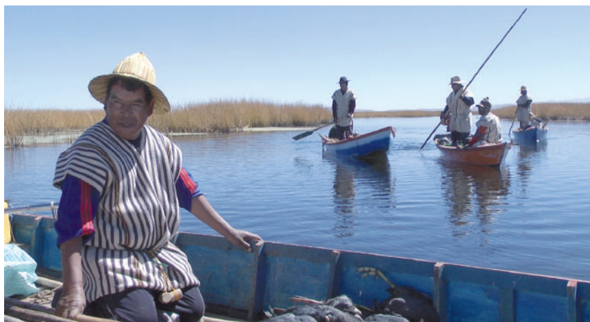
Familias en la actividad de la caza.