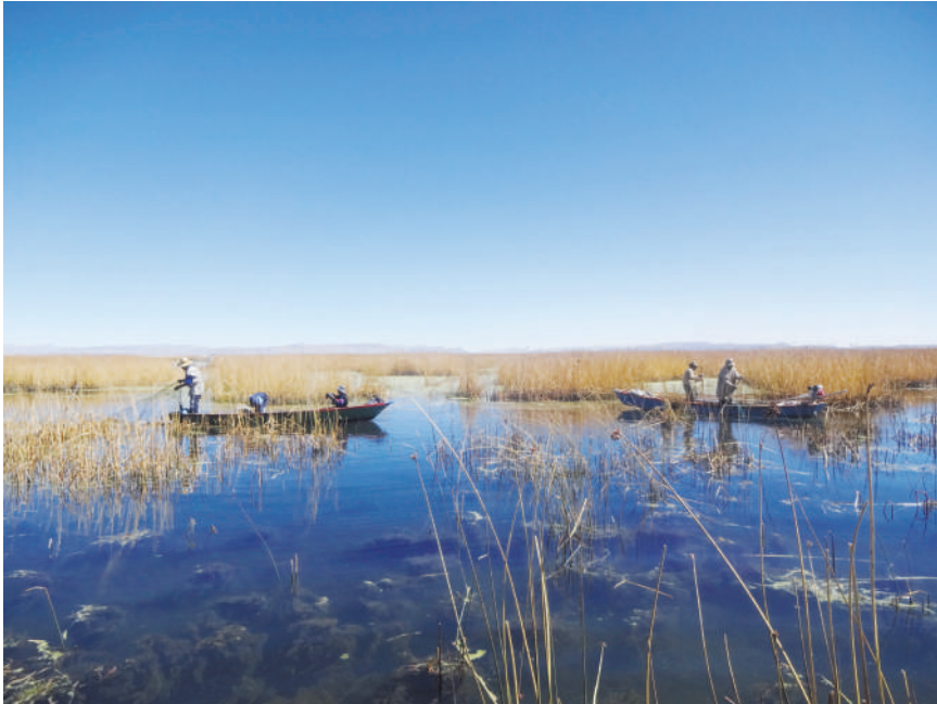
Actividades durante la pesca familiar.

La actividad de la pesca se realiza de manera familiar y prácticamente durante todo el año, exceptuando los meses de agosto y septiembre donde se declara veda y es controlada por las autoridades de la comunidad. Si bien la responsabilidad recae en los padres, también participan colaborando los hijos, de acuerdo a la edad y sus potencialidades. La pesca la realizan todas las familias, en promedio, tres veces por semana.