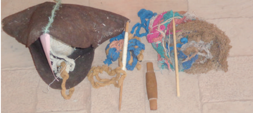
Herramientas y materiales para la construcción de las balsas.

Debido a la escasez de totora en algunos años y, también, a la posibilidad de usar otros materiales, en la actualidad también se fabrica botes o barcos metálicos o de plancha pero aplicando los saberes propios en el campo de la navegación y, obviamente, combinando con los saberes universales.