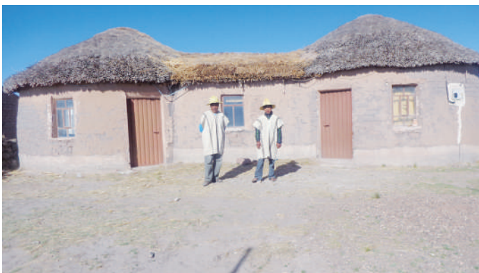
Vivienda ancestral en la comunidad.

La vivienda tradicional y/o ancestral de los iruhito se denomina qhoya que en castellano se traduce como casa redonda o circular, el mismo es construido con barro y tepes ( ch'ampa ) que son sacados de las orillas del río. El interior de dicha qhoya estaba equipado con esteras y colchones de totora. Este tipo de casas, según la historia oral, se mantuvo hasta los años setenta y desapareció por la influencia de los vecinos aimara que tienen casas rectangulares y con materiales de ladrillo, adobe y calamina. Probablemente, incidió significativamente el hecho de que varias mujeres aimara, para ese entonces, estarían ya casadas con varones iruhito.