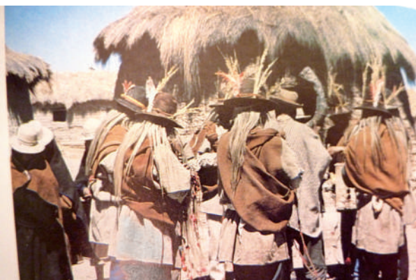
Fiesta en Iruito Urus.

En Bolivia la nación Uru está constituido por tres grupos 5 originarios que tienen la misma matriz sociocultural; a saber, el pueblo Iruhito Urus que está establecido al borde del Río Desaguadero de la Sección Municipal de Jesús de Machaca, Provincia Ingavi, del Departamento de La Paz; el Uru de Lago Poopó –o muratos- localizado en las Comunidades de Puñaca Tinta María, Llapallapani y Vilañique del Departamento de Oruro 6 ; y el Uru Chipaya 7 que se encuentra en la Provincia Sabaya del Departamento de Oruro.