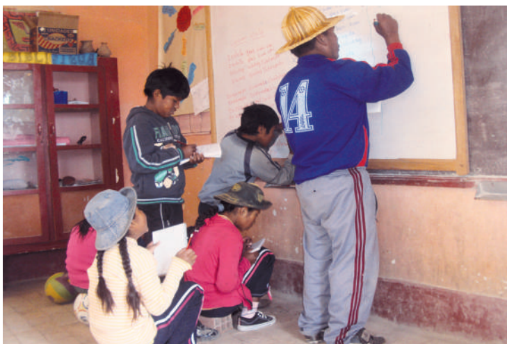
Enseñanza de la lengua uchumataqu en la escuela.

Paz. La mayoría de los estudiantes que deben cursar los grados del nivel secundario, por lo general, lo realizan en los Colegios de Janq'o Jaqi y Qurpa; en este último lugar existe un internado y, por ello, los estudiantes permanecen de lunes a viernes y los fines de semana retornan a su comunidad.