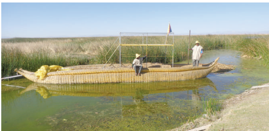
Balsa pedagógica construida por la comunidad.

La balsa de totora se construye desde tiempos inmemoriales y este instrumento es un elemento principal porque se usa para la pesca, la casa y la recolección de huevos de aves silvestres, actividades sustantivas de la forma de ser de los uru. En la comunidad se construye diferentes tamaños de balsas o embarcaciones de acuerdo al tipo de actividad que se quiera realizar; por lo general, las balsas son de tamaño pequeño (para perseguir a las aves y para la caza nocturna), mediano (para realizar la pesca con redes) y grande (para transportar totora y para el desplazamiento familiar). En el 2012, con el apoyo de la Fundación Machaqa Amawta, la comunidad construyó una balsa pedagógica con una capacidad de 50 personas que es utilizado para el turismo y para actividades de investigación acerca de los saberes y conocimientos lacustres.