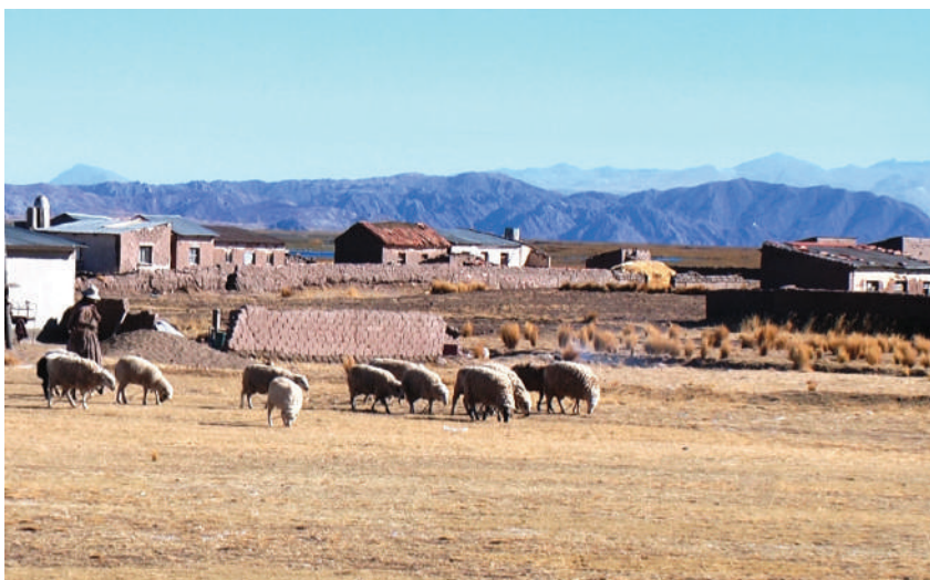
Vista panorámica de la Comunidad Iruhito Uru.

La extensión territorial de la Comunidad de Iruhito Uru alcanza a 545 kilómetros cuadrados que equivalen a 54,5 hectáreas (GMV 1998: 48). En todo este espacio, las personas desarrollan actividades relativas al cultivo agrícola y al pastoreo, así como a las actividades domésticas íntimamente relacionadas con la vivienda familiar. De las 54,5 hectáreas que posee, 11,95 hectáreas están destinadas al solar campesino y a los servicios; 31,92 hectáreas son utilizadas en las actividades agrícolas; y 10,63 hectáreas constituyen la superficie donde se desarrolla la actividad del pastoreo (THOA S/a: 2). De acuerdo con los dirigentes, la comunidad cuenta con un título comunitario que les proporcionaron cuando tramitaron la Tierra Comunitaria de Origen (TCO); lamentablemente, no poseen los títulos individuales o familiares.