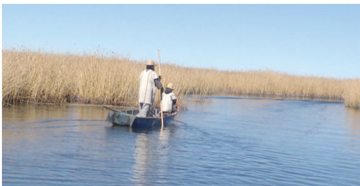
Padre e hijo transportandose hacia comunidades aledañas.

También se puede llegar a la comunidad mediante transporte pluvial; es decir, a través de barcos y botes desde cualquier lugar del Río Desaguadero y del Lago Titicaca. Pero este medio de transporte, normalmente, es poco usado por el tiempo y el costo elevado que implica, con relación al transporte terrestre.