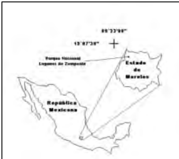
Figura 1. Ubicación del Parque Nacional Lagunas de Zempoala.

Fisiográfica del Eje Volcánico Transversal, originada durante la Revolución Laramídica, cuando se conformó la Sierra de Zempoala. Los suelos dominantes de la región son andosoles de tipo húmico, derivados de material volcánico reciente, con alta capacidad de retener agua, de erosionarse y de fijar fósforo (López-García, 1990).