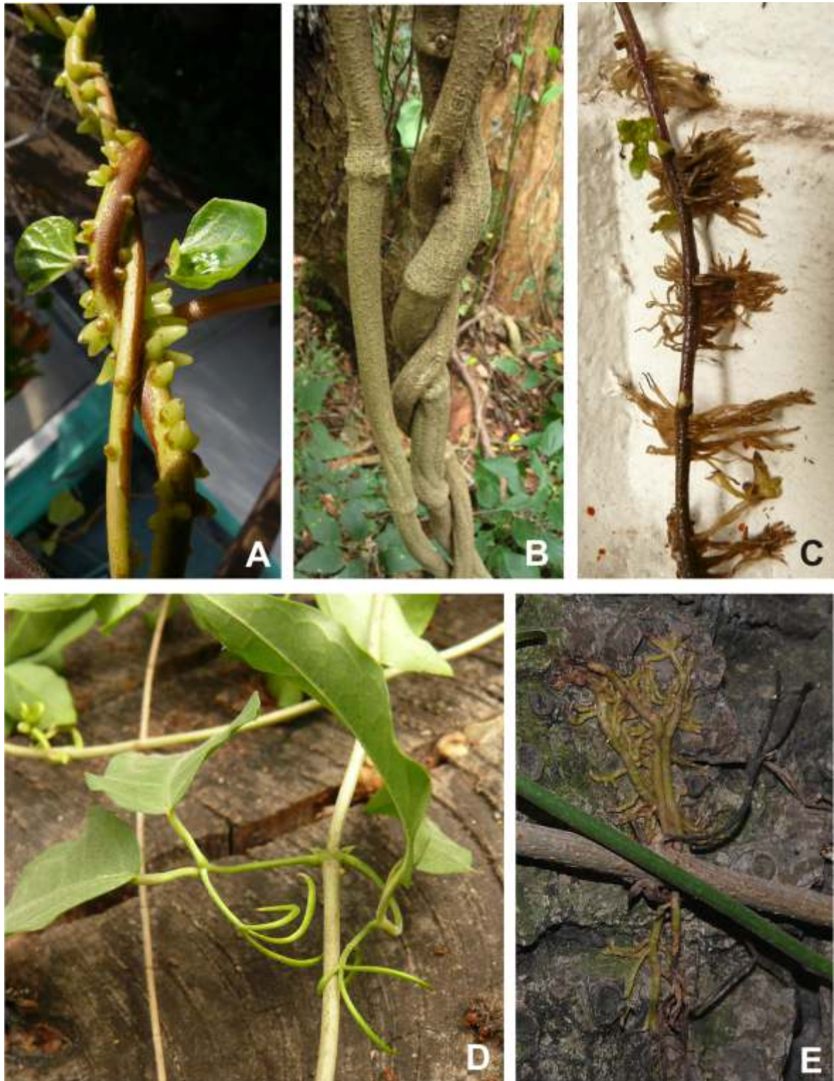
Figura 1. Mecanismos de ascenso: A Ipomoea alba vástagos volubles herbáceos y verrugas; B Callaeum psilophyllum vástagos volubles leñosos y entrenudos engrosados; C Hedera helix raíces adventicias de fijación; D, E Dolichandra unguis-cati zarcillos foliares uncinados (D) y raíces adventicias de fijación (E).