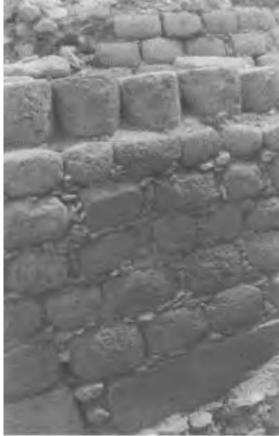
Sección de muro en la Plataforma IV. Notar el detalle en la pestaña de retiro. Precerámico tardío.