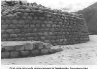
Detalle de la masonería en la pestaña de retiro de Tambóllullo. Precerámico final