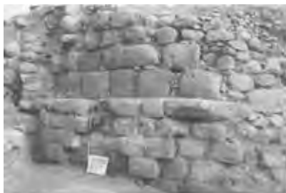
La cuadrícula FSN en proceso de excavación; frente norte de Tumbokalka. Precerámico tardío.