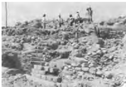
Excavación en la cuadrícula FSN del frente norte de Tumbokalka. Estemos demostrando un gran muro surco. Precerámico tardío.