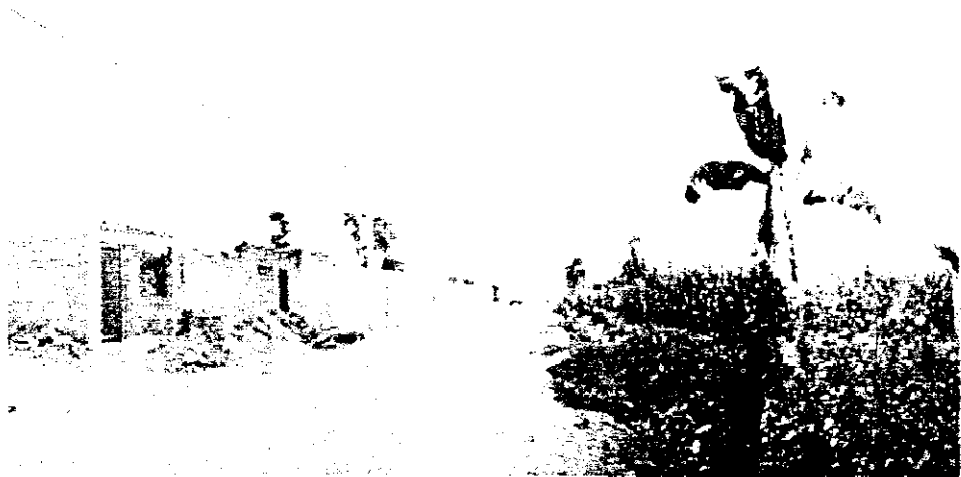
Asentamiento urbano popular constituido en la periferia de la ciudad de Huaral.

La migración indígena hacia las ciudades es uno de los más importantes vehículos de proceso de cholificación, afecta sobre todo a las capas jóvenes del campesino indígena.