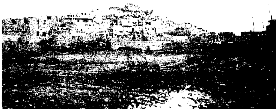
Pueblo joven «San Cristobal de Huaral», Huaral.

La vida cotidiana de los diversos grupos étnicos del valle de Chancay, en relación al medio ambiente, muestra una actitud muy diversa presentando en algunos grupos étnicos una carencia de conciencia ambiental que se traduce en el progresivo deterioro del medio en que viven, en unos casos, por el bajo nivel educativo y, en otros, por la pérdida de valores de la ciudadanía en relación a la conservación del medio ambiente. A continuación presentamos algunos rasgos que presentan estos grupos étnicos.