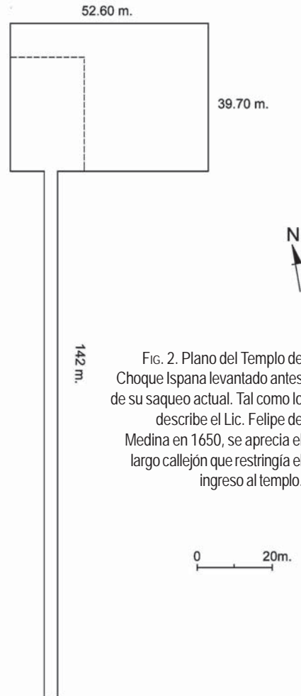
Fig. 2. Plano del Templo de Choque Ispana levantado antes de su saqueo actual. Tal como lo describe el Lic. Felipe de Medina en 1650, se aprecia el largo callejón que restringía el ingreso al templo.

De veintiún fragmentos de recipientes de cerámica se distingue algunos con engobe blanquecino o rojizo y otros con decoración geométrica pintada o a relieve en la superficie externa (dos tiestos). Un fragmento de vaso lleva el diseño algo borroso por acción del tiempo de un personaje antropomorfo con penachos o