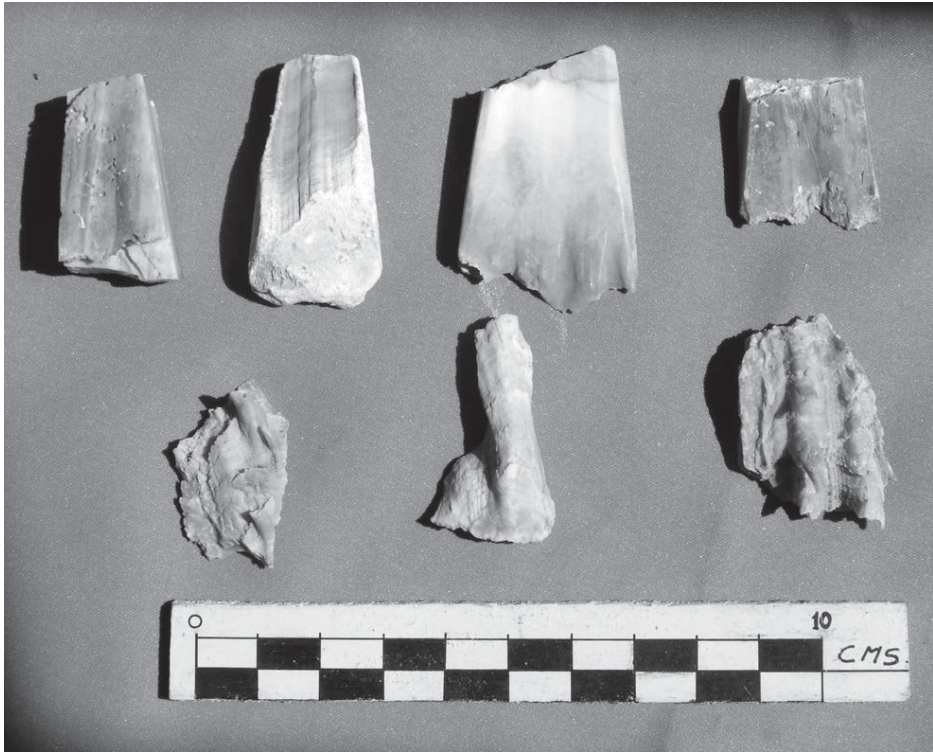
Fig. 5. Objetos confeccionados de la concha spondylus, procedentes de los mares tropicales del Ecuador, encontrados en la Huaca Choque Ispana.

cia de templos que fueron identificados por los evangelizadores de la época colonial quienes señalaron claramente, por ejemplo, a los centros religiosos de Carquín y Choque Ispana adonde peregrinaban gentes que vivían a todo lo largo de las cuencas vecinas al valle de Huaura. Tuvieron, asimismo, dos definidos estilos alfareros, expresados en la vajilla denominada Chancay Negro sobre Blanco y Cayash. La primera con fuerte presencia en la zona yunga de los valles de Huaura y Huaral y la segunda distribuida tanto en la región costeña como en la parte altoandina donde es predominante. Queremos añadir que de los fragmentos observados en Choque Ispana nos llama la atención uno que tiene un dibujo antropomorfo en la superficie, de cuya cabeza se proyectan a manera de dos rayos que pueden tal vez ser la representación de la misma imagen que estaba grabada en la escultura de piedra que el padre Medina destruyó. Ese tipo de figuras aparecen en vasos procedentes del valle de Huaura que inicialmente fueron reconocidos como un estilo del mismo nombre, es decir, de tiempos del Intermedio Tardío. Tal fue la importancia de los Chancay del valle de Huaura que el mismo reino de Chimú había establecido alianza estratégica con ellos, pues uno de sus gobernantes, precisamente Minchancaman , había tenido un hijo en una noble huaurina,