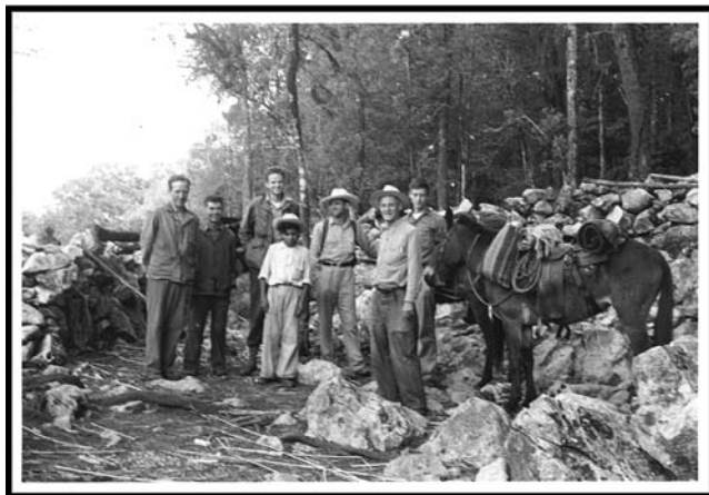
Paul S. Martin (al frente, con sombrero), acompañado con el primer grupo de científicos que visitó Rancho del Cielo en 1947

En dicho capítulo, Paul S. Martin ofrece una descripción biológica y de las comunidades humanas, propias de la Reserva de la Biosfera El Cielo, en viajes realizados por el autor, durante la década 1940-1950. El capítulo, un documento no solo de valor científico, sino histórico, agrupa y hace referencia a los inicios del conocimiento de la biodiversidad y desarrollo científico realizado en la zona por parte de los primeros investigadores, y ofrece un marco de referencia con el cual confrontar los estudios más recientes. Esta reseña histórica hace evidente la gran importancia de la zona desde el punto de vista de la ecología y la biogeografía, y subraya la urgente necesidad de profundizar en el conocimiento y la conservación de tan sobresaliente región.