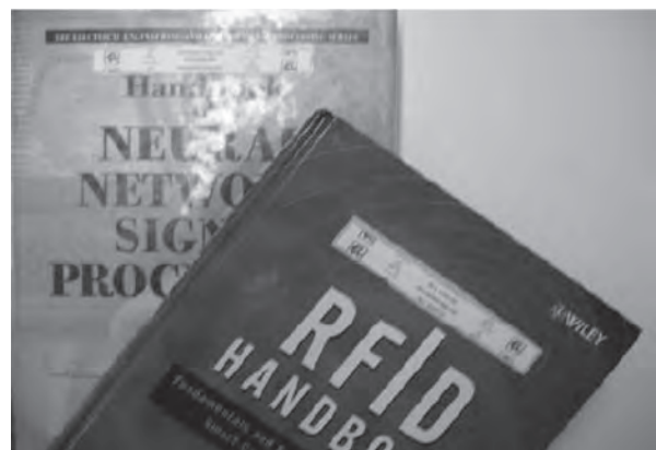
Figura 4. Etiquetas transponder R/W modelo ALL-9338.

La identificación de equipos se lleva a cabo mediante el transponder tipo etiqueta modelo ALL-9338 (figura 4). Éste es colocado en los equipos para evitar que puedan ser extraído. El transponder seleccionado es pasivo, funciona a una frecuencia de operación superior a 902,75 MHz e inferior a 927,25 MHz y, además, es de tipo lectura/escritura, lo que permite modificar su código sin tener la necesidad de extraerlo del equipo. Estos números están protegidos bajo una clave dinámica para evitar que el usuario pueda modificarlo.