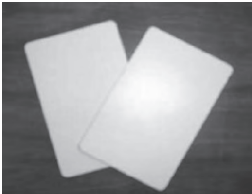
Figura 2. Tarjetas transponder R/O modelo RI-TRP-R4FF.

La identificación de personas se lleva a cabo mediante un transponder tipo tarjeta. Dicho transponder es pasivo y de solo lectura, evitando que los usuarios puedan modificar su número de registro y funcionando a una frecuencia de 134 kHz. El transponder modelo RI-TRP-R4FF, mostrado en la figura 2, cumple con todos los requisitos necesarios para la aplicación.