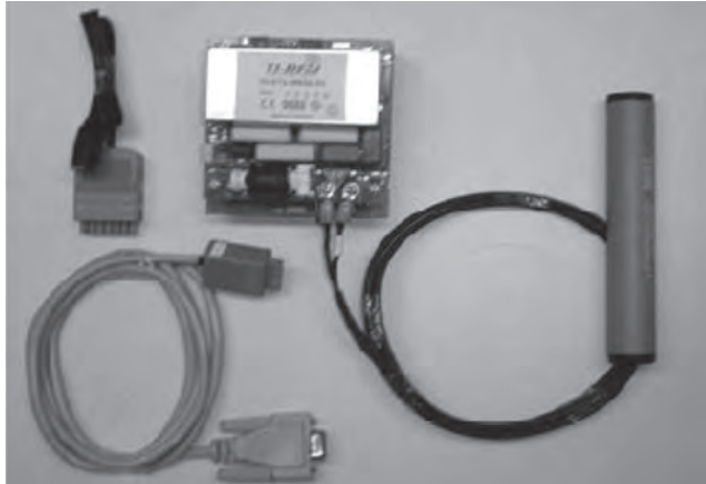
Figura 1. Dispositivo de adquisición de Radiofrecuencia TI modelo RI-STU-MB2A.

frecuencia de identificación de 134 kHz. Se utilizó la antena modelo RI-ANT-S01C. Con ésta, el dispositivo de adquisición tiene un alcance no mayor a 30 cm para el transponder pasivo, por lo que es utilizado en la identificación de los usuarios al no requerirse de un mayor alcance, sino de solo acercarse por parte del usuario. El dispositivo de adquisición se comunica por protocolo de comunicación serial RS-232.