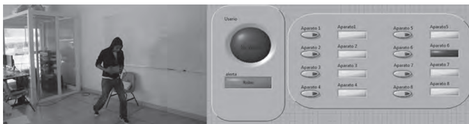
Figura 9. Prevención de robo.