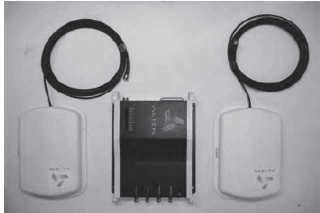
Figura 3. Dispositivo de adquisición Radiofrecuencia Alien Technology modelo ALR9800.

927,25 MHz. Las antenas utilizadas son del modelo ALR-9610-BC. Con éstas, el dispositivo de adquisición tiene un alcance aproximado de 2 m, por ello son ideales para ser colocadas en los accesos y así evitar los plagios. El dispositivo de adquisición Alien permite la detección de cada transponder por separado, ya que cuenta con la propiedad de anticollisión. El dispositivo de adquisición presenta dos puertos de comunicación, ya sea mediante protocolo RS-232 o por TCP/IP.