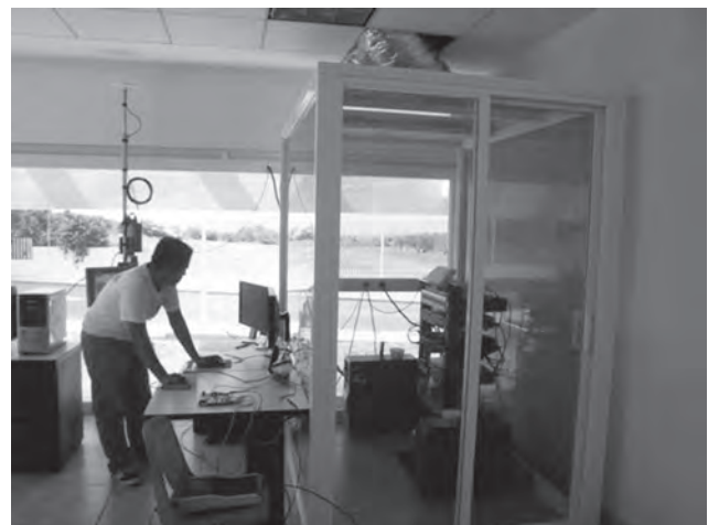
Figura 7. Sistema instalado.