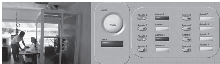
Figura 8. Usuario válido.