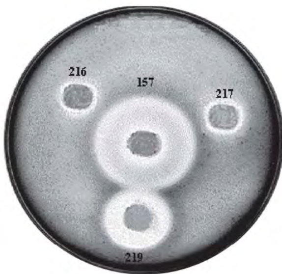
Figura 3. Análisis fenotípico de la actividad celulolítica producida in situ por las cepas E. coli PERM 157 (silvestre) y las mutantes PERM216, PERM217 y PERM219.