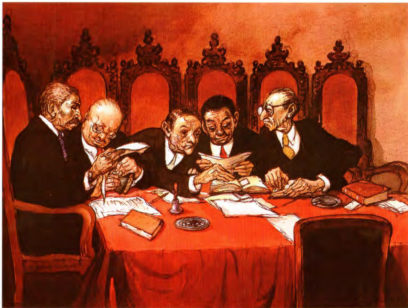
Preparando el fallo.