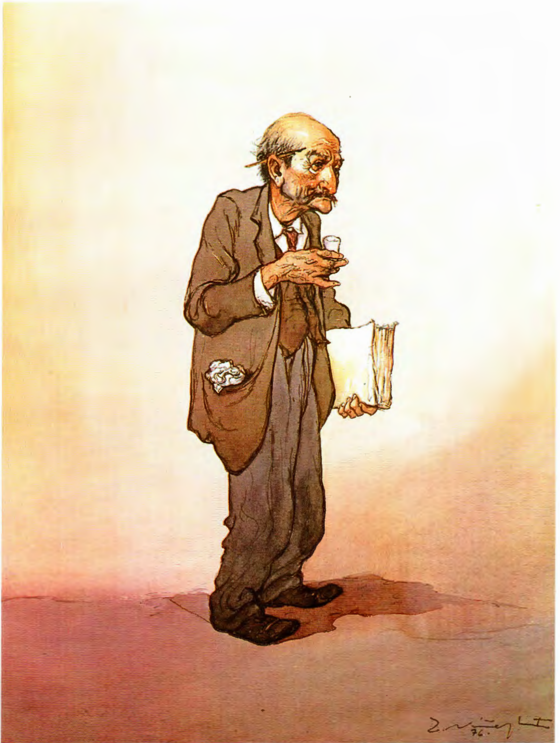
El escribano de los buenos tiempos.